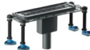
DallFlex 2.0 senkrecht