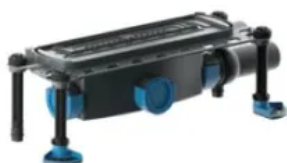
DallFlex 2.0 115