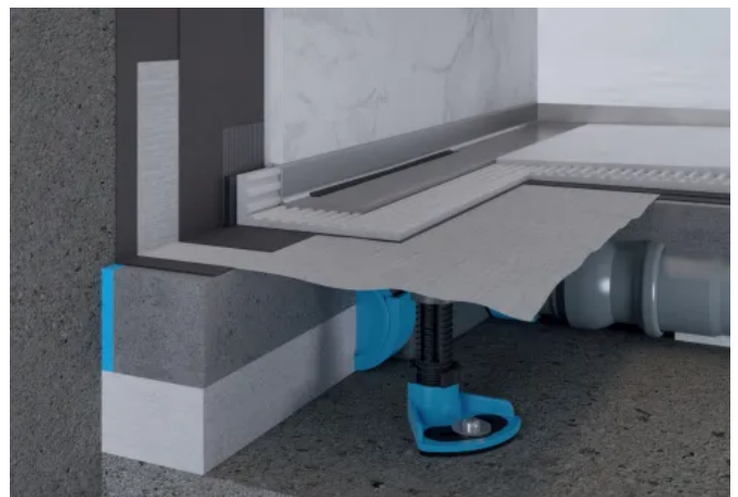
Einbaubeispiel Ablaufgehäuse DallFlex 2.0 mit Duschrinne CeraWall Select