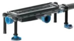
DallFlex 2.0 Plan