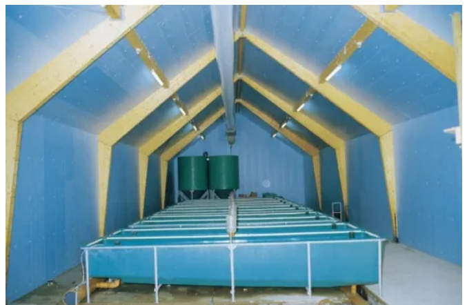
Dämmung eines Beckens für Fischzucht