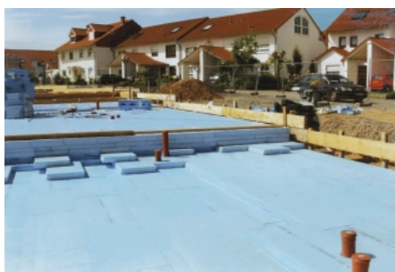
Verlegung der RAVATHERM™ XPS-Dämmplatten