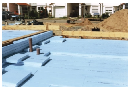
Verlegung der RAVATHERM™ XPS-Dämmplatten