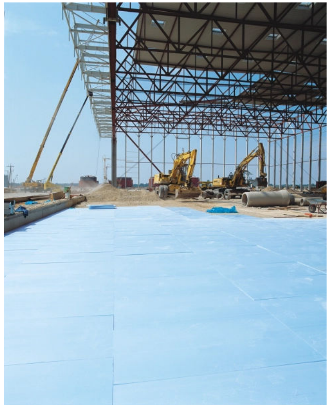
Wärmedämmung oberhalb der Bodenplatte

Das geringe Gewicht der RAVATHERM™ XPS Platten sowie die verarbeitungsgerechten Maße (RAVATHERM™ XPS 500–SL und 700–SL: 1250 x 600 mm) erlauben ein schnelles, leichtes und wirtschaftliches Verlegen. Die Verlegung erfolgt lose auf den ebenen Untergrund.