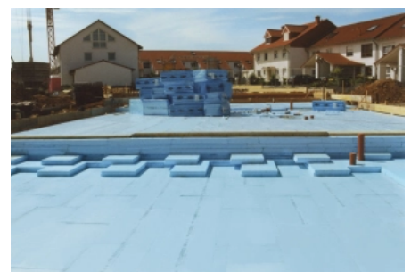
Verlegung der RAVATHERM™ XPS-Dämmplatten