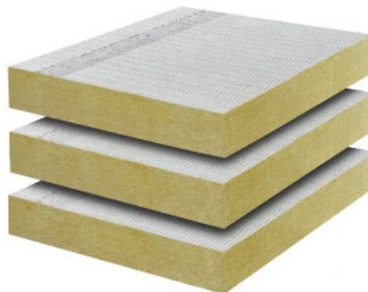
Kellerdecken-Dämmplatte 3653 gesprenkelt