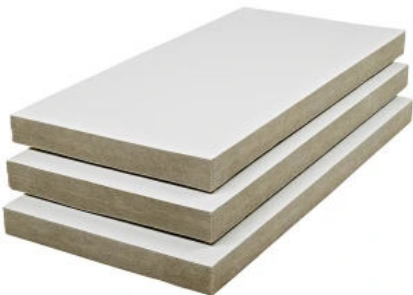
Kellerdecken-Dämmplatte 3653 weiß