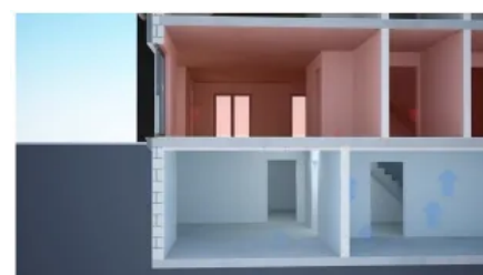
Heizwärmeverlust über eine ungedämmte Kellerdecke