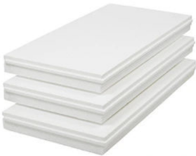
Qju Kellerdecken-Dämmplatte 3703