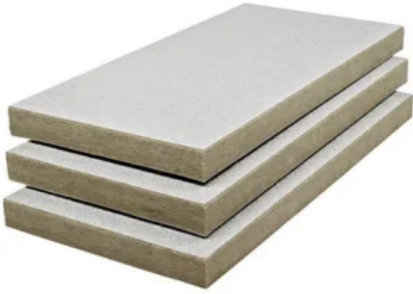
Kellerdecken-Dämmplatte 3654 smartline