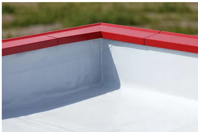
alwitra select Farbprogramm