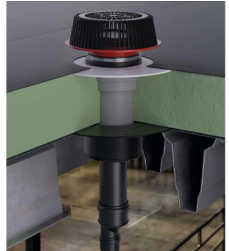
Notablauf SuperDrain 62, DN 70, mit Brandschutzelement für Stahltrapezprofildach

Laut DIN 1986 - 100 muss jedes Flachdach gegen das „Fünfminutenregenereignis einmal in 100 Jahren“ abgesichert werden. Dallmer Notabläufe (Dachablauf mit Anstaurung) entwässern das Flachdach dort, wo das Wasser anfällt. Und das mit erheblich besseren Ablaufleistungen als einfache Attikaabläufe aufweisen.