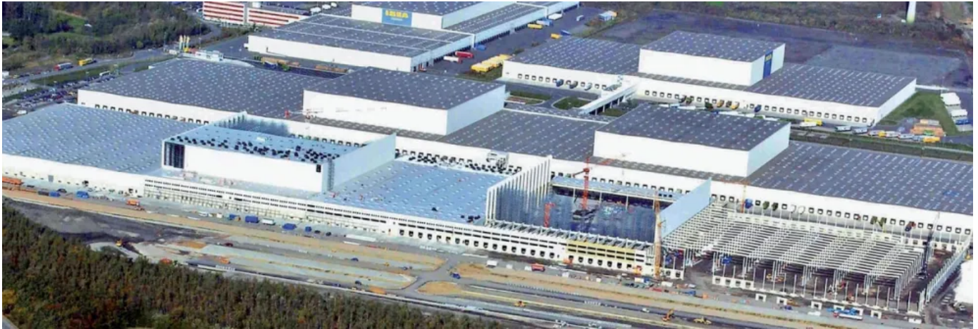
Flachdachentwässerung mit Druckströmung – Europa-Zentrallager IKEA, Deutschland