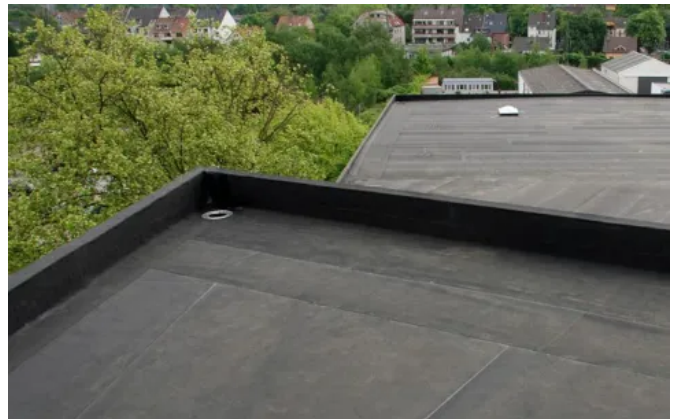
HERTALAN® EASY WELD GS

Die Abdichtungsbahn ist auf vielen Untergründen und auch für Dachneigungen über 20° einsetzbar. Man unterscheidet zwischen HERTALAN EASY WELD GS MF für die mechanische Befestigung und HERTALAN EASY WELD GS BASIC für die lose Verlegung mit Auflast oder die verklebte Verlegung.