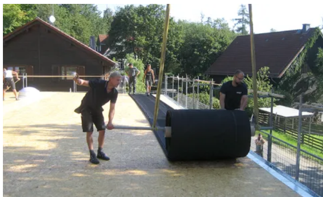
HERTALAN® EASY COVER