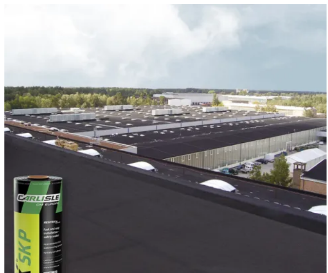
RESITRIX® SK Partial Bond

Weitere Informationen: RESITRIX® SK Partial Bond