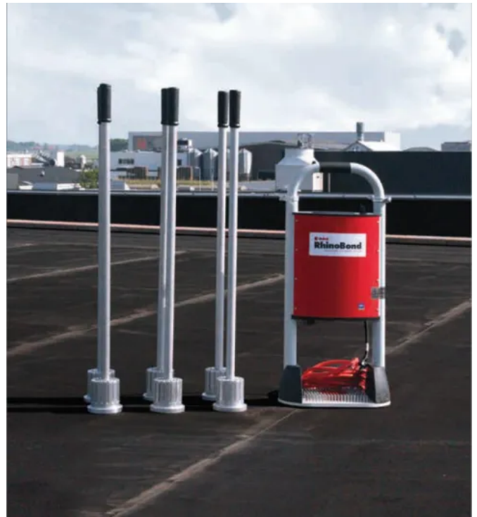
HERTALAN® RhinoBond Befestigungssystem