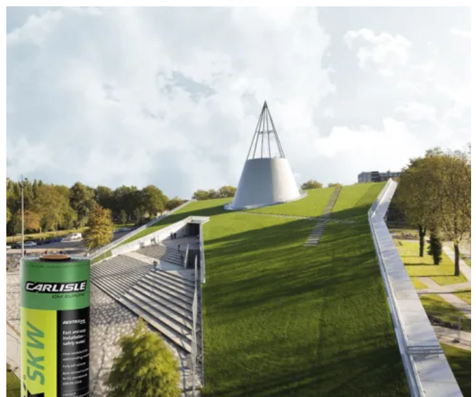
RESITRIX® SK W Full Bond