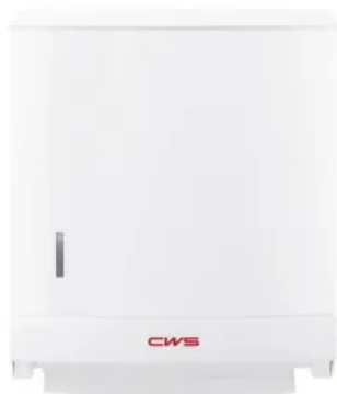
CWS Faltpapierspender Paradise Paper Slim

Der Faltpapierspender bietet eine Kapazität für bis zu 300 Papierhandtücher in Lagen- oder in Zick-Zack-Faltung. Durch leichtes Herausziehen erhält der Benutzer sein persönliches Papierhandtuch.