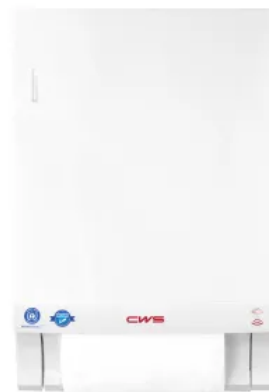
CWS Stoffhandtuchspender Paradise Dry Slim

Sparsamer und umweltschonender Seifenschaumspender mit 500 ml Kapazität für Seifenkonzentrat, ausreichend für ca. 1.250 Portionen. Durch das Aufschäumen des Seifenkonzentrats wird der Seifenverbrauch um bis zu 50 % reduziert. Das Nachtropfen der Seife wird durch die Rücksaugpumpe verhindert.