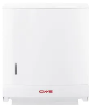
CWS Faltpapierspender Paradise Paper Slim

Der Faltpapierspender bietet eine Kapazität für bis zu 300 Papierhandtücher in Lagen- oder in Zick-Zack-Faltung. Durch leichtes Herausziehen erhält der Benutzer sein persönliches Papierhandtuch.