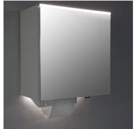
Alle CWS Siegelschränke können optional mit einem LED Alu-Profil als Oberbeleuchtung und als Waschtischbeleuchtung ausgestattet werden.

Die CWS-Spendersysteme entsprechen den gesetzlichen Regelungen zur Handhygiene, definiert in der Arbeitsstättenrichtlinie, Europäischen Lebensmittelhygieneverordnung und Unfallverhütungsvorschrift „Gesundheitsdienst“.