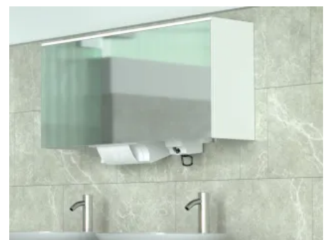
ObjectLine Spiegelschrankmodul mit Stoffhandtuchspender und Seifenschaumspender

CWS bietet dazu ein abgestimmtes System mit moderner, wartungsarmer Technik im Spiegelschrank. Der stabile CWS Spiegelschrank mit den Standardmaßen H x B x T 600 x 600 x 330 mm verfügt über einen weißen Korpus und eine schwenkbare Spiegelfront. Bei der Doppel-Ausführung werden zwei Einzelschränke kombiniert. Optional lassen sich individuelle Maßanfertigungen möglich. Alle Spiegelschränke können optional mit einem LED Alu-Profil als Oberbeleuchtung und als Waschtischbeleuchtung ausgestattet werden.