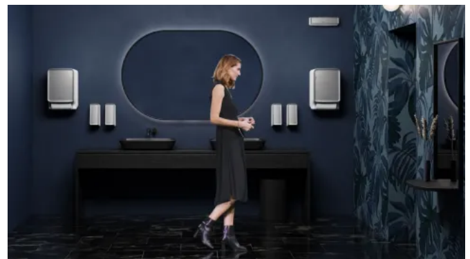
CWS PureLine in öffentlichen oder gewerblichen Bereichen