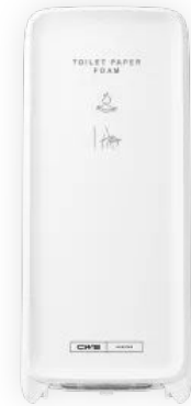
CWS PureLine Toiletpaper Foam Non-Touch

Der neue CWS Toilet Paper Foam Spender ist eine Feuchtreinigung mit Toilettenpapier-Schaum. Die Reinigung mit Toilettenpapierschaum ist eine umweltfreundliche, ökologische Alternative zu feuchtem Toilettenpapier. Die Annäherung an den Sensor des Spenders aktiviert den Pumpgenerator, das Zurückziehen der Hand stoppt die Ausgabe. Der Seifenschaum fließt direkt auf das Toilettenpapier. Der Intimbereich kann effektiv gereinigt werden. Die wiederverschließbare Flasche mit dermatologisch getestetem Seifenschaum wird einfach in das Schubladen-System des Spenderseingesetzt. Seifenschaumflasche und Pumpe bilden ein in sich geschlossenes System und sind somit geschützt vor äußeren Einflüssen. Die LED-Lichtleiste zeigt den Funktionsstatus des Spenders an. Für eine individuelle Gestaltung können alle Produkte der CWS PureLine mit unterschiedlichen Panelfarben Weiß, Silber und Mint an die Waschraumsituation angepasst werden.