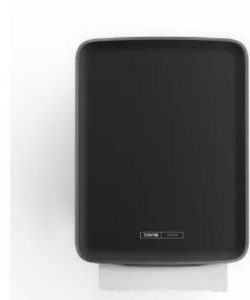
CWS PureLine EcoBlack Paperroll Non-Touch Hybrid

Da der Spender batteriebetrieben ist, lässt er sich flexibel an nahezu jedem Ort installieren. Zusätzlich ist er vollständig IoT-fähig und kann über die CWS smartMate Lösung in ein digitales Gebäudemanagement eingebunden werden, um Füllstände und Nutzungsdaten in Echtzeit auszuwerten. Die verwendeten Papierrollen sind mit dem EU Ecolabel und dem FSC-Siegel zertifiziert und unterstützen damit nachhaltige Waschraumkonzepte.