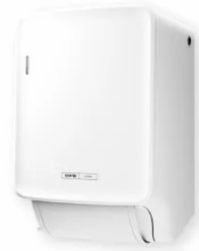
CWS PureLine Dry Stoffhandtuchspender

Für eine individuelle Gestaltung können alle Produkte der CWS PureLine mit unterschiedlichen Panelfarben Weiß, Silber und Mint an die Waschrumsituation angepasst werden.