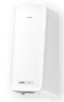
CWS PureLine Cream NT

Für eine individuelle Gestaltung können alle Produkte der CWS PureLine mit unterschiedlichen Panelfarben Weiß, Silber und Mint an die Waschrumsituation angepasst werden.