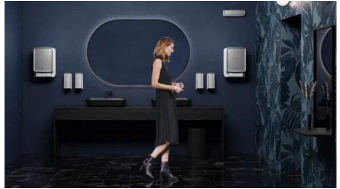
CWS PureLine in öffentlichen oder gewerblichen Bereichen