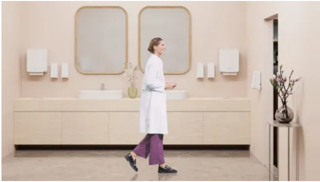
CWS PureLine in medizinischen Bereichen

Aus der Serie CWS PureLine Waschraumausstattungen von CWS Hygiene Deutschland