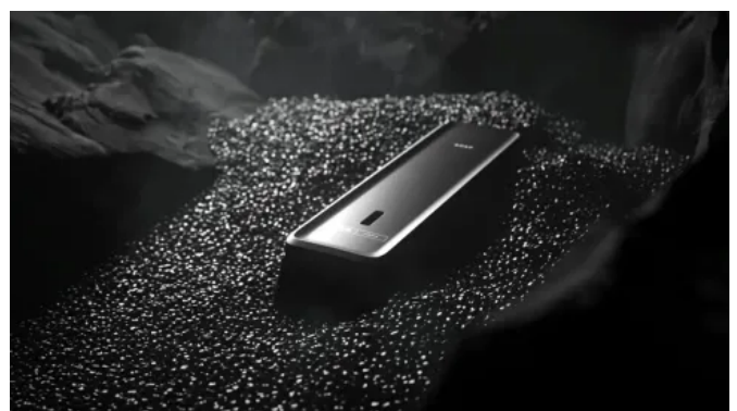
CWS PureLine EcoBlack Produkte werden überwiegend aus recyceltem Kunststoff (bis zu 98 %) hergestellt.

Auch im Betrieb setzt CWS hier auf einen ressourcenschonenden Ansatz. Zu den nachhaltigen Verbrauchsmaterialien zählen z. B. Seifen auf Basis wiederverwerteter natürlicher Reststoffe wie aufbereitetem Orangenöl, waschbare Stoffhandtuchrollen sowie FSC-zertifiziertes Papier aus Recyclingkartonagen. Diese Nachfüllmaterialien tragen dazu bei, Abfall zu reduzieren und gleichzeitig hohe Hygienestandards einzuhalten.