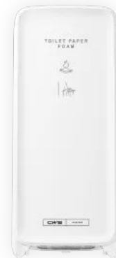
CWS PureLine Toiletpaper Foam Non-Touch

Der neue CWS Toilet Paper Foam Spender ist eine Feuchtreinigung mit Toilettenpapier-Schaum. Die Reinigung mit Toilettenpapierschaum ist eine umweltfreundliche, ökologische Alternative zu feuchtem Toilettenpapier. Die Annäherung an den Sensor des Spenders aktiviert den Pumpgenerator, das Zurückziehen der Hand stoppt die Ausgabe. Der Seifenschaum fließt direkt auf das Toilettenpapier. Der Intimbereich kann effektiv gereinigt werden. Die wiederverschließbare Flasche mit dermatologisch getestetem Seifenschaum wird einfach in das Schubladen-System des Spenderseingesetzt. Seifenschaumflasche und Pumpe bilden ein in sich geschlossenes System und sind somit geschützt vor äußeren Einflüssen. Die LED-Lichtleiste zeigt den Funktionsstatus des Spenders an. Für eine individuelle Gestaltung können alle Produkte der CWS PureLine mit unterschiedlichen Panelfarben Weiß, Silber und Mint an die Waschraumsituation angepasst werden.