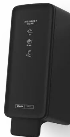
CWS PureLine Black Disinfect Foam Desinfektionsmittelspender