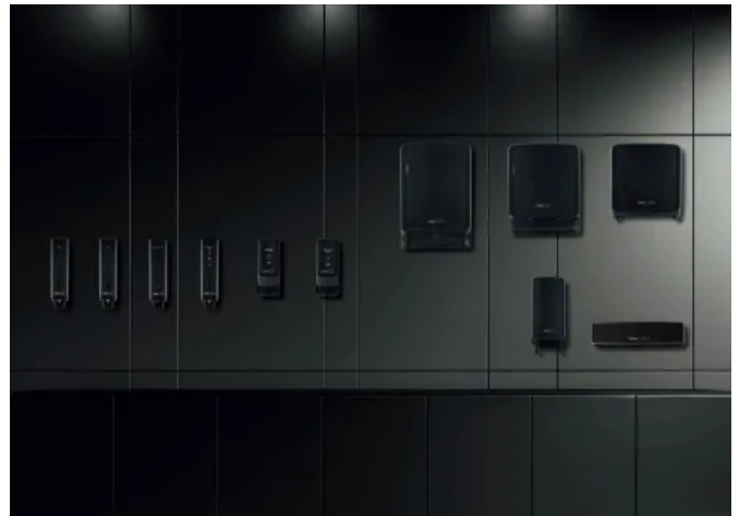
CWS PureLine EcoBlack für nachhaltige Ausstattungen im Sanitärraum

Auch im Betrieb setzt CWS hier auf einen ressourcenschonenden Ansatz. Zu den nachhaltigen Verbrauchsmaterialien zählen z. B. Seifen auf Basis wiederverwerteter natürlicher Reststoffe wie aufbereitetem Orangenöl, waschbare Stoffhandtuchrollen sowie FSC-zertifiziertes Papier aus Recyclingkartonagen. Diese Nachfüllmaterialien tragen dazu bei, Abfall zu reduzieren und gleichzeitig hohe Hygienestandards einzuhalten.