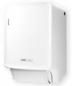
CWS PureLine Dry Stoffhandtuchspender

Für eine individuelle Gestaltung können alle Produkte der CWS PureLine mit unterschiedlichen Panelfarben Weiß, Silber und Mint an die Waschrumsituation angepasst werden.