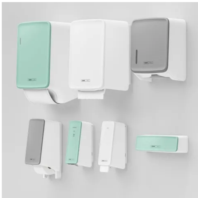
Die CWS PureLine Spender können mit verschiedenen Paneelfarben an die Waschräumsituation angepasst werden. CWS PureLine Black-Modelle sind komplett schwarz.

CWS sorgt für einen kompletten Hygieneservice: Der hauseigene Lieferservice sorgt für den regelmäßigen Austausch von sauberen Stoffhandtuchrollen, Schmutzfangmatten, Duftspendern und Damenhygieneboxen. Auch die Überprüfung der Funktionsfähigkeit des selbst reinigenden Toilettensitzes CleanSeat übernimmt der CWS Kundendienst.