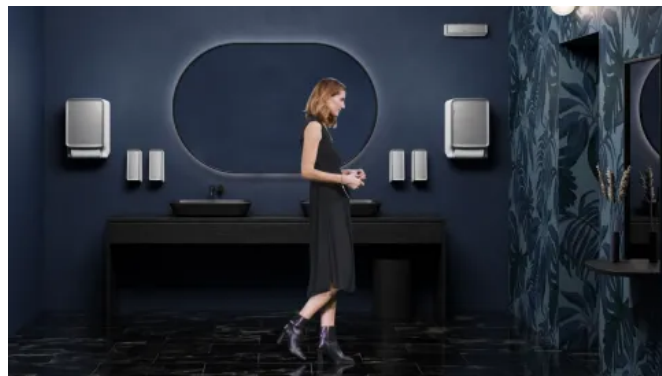
CWS PureLine in öffentlichen oder gewerblichen Bereichen