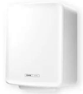
CWS PureLine Paperroll NT Hybrid Rollenpapierspender

Für eine individuelle Gestaltung können alle Produkte der CWS PureLine mit unterschiedlichen Panelfarben Weiß, Silber und Mint an die Waschrumsituation angepasst werden.