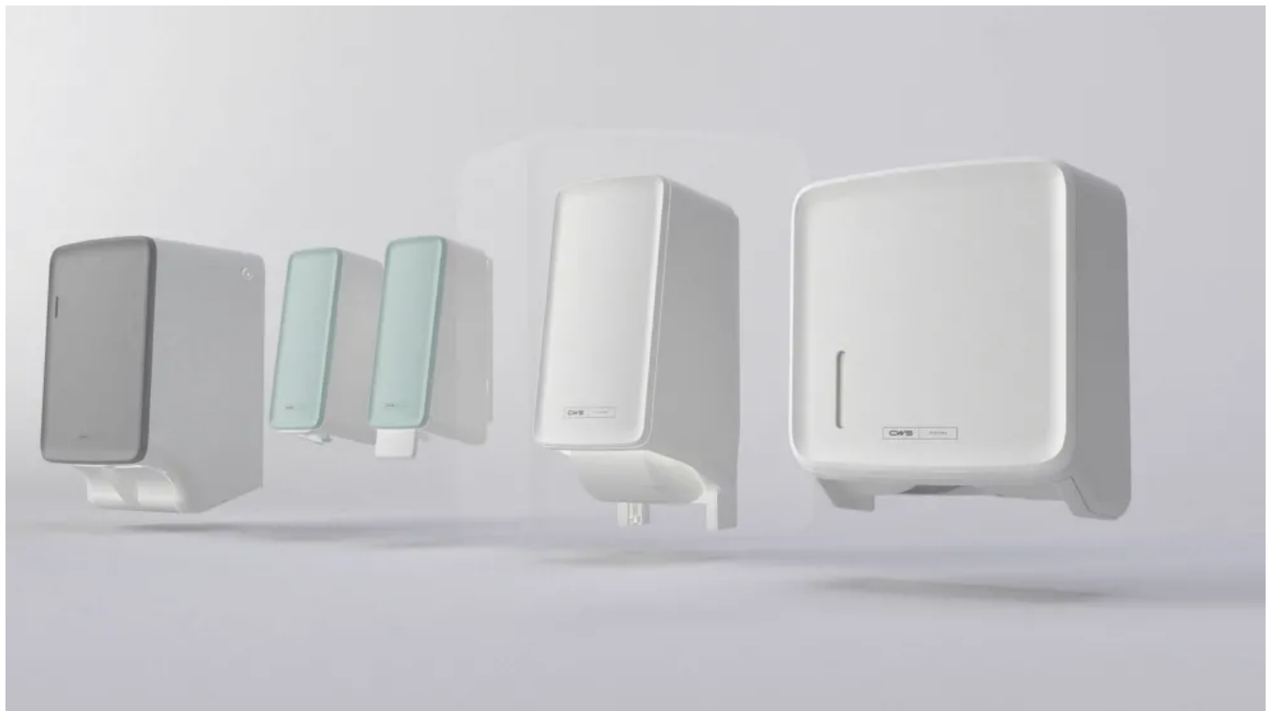
CWS PureLine Produktvideo

Insgesamt steht PureLine EcoBlack für ein ganzheitliches Nachhaltigkeitskonzept, das Design, Materialeinsatz, Ressourceneffizienz und Kreislaufwirtschaft kombiniert.