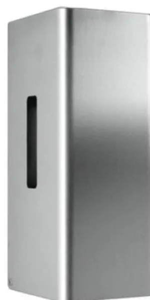
Der Toilettenpapierspender für 2 Rollen stellt sicher, dass immer ausreichend Papier zur Verfügung steht.