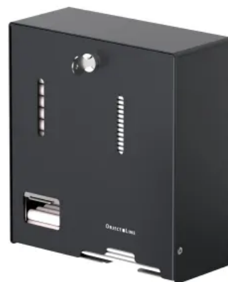
CWS ObjectLine Kombispender für Tampons und Hygienebinden Variante Edelstahl, schwarz pulverbeschichtet, RAL 9005