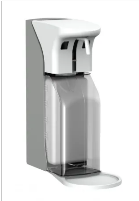
Der Universalspender Non-Touch 500 und 1000 ist speziell für den Klinik- und Praxisbedarf konzipiert.

Aus der Serie CWS ObjectLine Waschräumeausstattungen von CWS Hygiene Deutschland