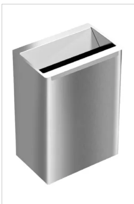
Die Abfallbehälter gibt es in drei Größen: mit 24, 40 oder 60 Liter Füllvolumen. Der Einwurf ist offen und so abgeschrägt, dass er einen Sichtschutz bildet.