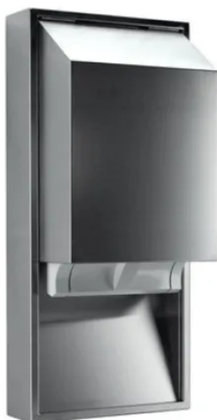
Die Stoffhandtuchspender nehmen für 21 cm breite Stoffhandtuchrollen auf. Bei den Bedienungsvarianten kann zwischen mechanischer und Non-Touch Version gewählt werden.