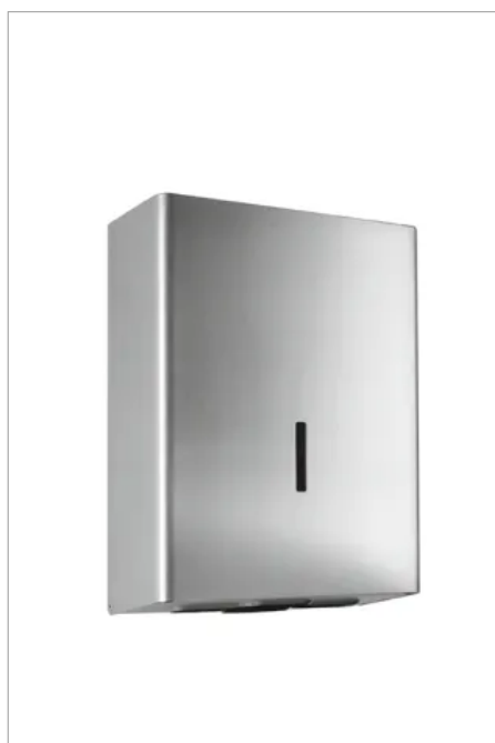
Der Papierhandtuchspender fasst 750 Faltblätter und vermeidet durch die abgerundete Haubenform ein mögliches Verletzungsrisiko.