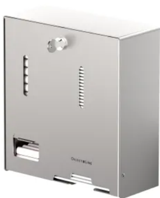
CWS ObjectLine Kombispender für Tampons und Hygienebinden Variante Edelstahl, matt gebürstet

Die neuen Kombispender für Tampons und Hygienebinden leisten besonders in öffentlichen oder halböffentlichen Bereichen, wie am Flughafen, in der Schule oder Uni, im Restaurant oder auch am Arbeitsplatz einen wichtigen Beitrag zu Wohlfühlhygiene und Infektionsschutz.