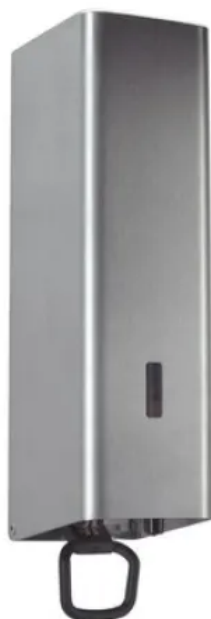
Die Spender für Seifencreme bzw. Seifenschaum, wahlweise mit 0,5 oder 1 Liter Inhalt lassen sich mit einer Hand bedienen.

Aus der Serie CWS ObjectLine Waschraumausstattungen von CWS Hygiene Deutschland