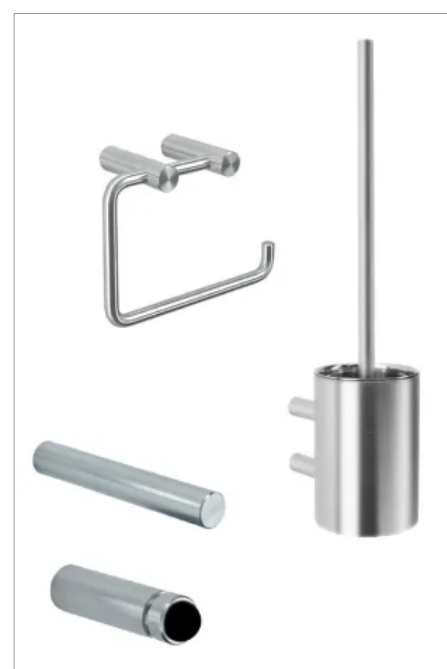
Zu den Spendern werden passende Ergänzungsprodukte angeboten: Toilettenpapierhalter, Reserverollenhalter, Türpuffer/Haken und Bürstengarnituren.