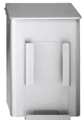
CWS MediLine Hygienebox 6 Liter

Als Werkstoff-/Oberflächenvarianten stehen Aluminium eloxiert, Aluminium weiß pulverbeschichtet und Edelstahl zur Auswahl.