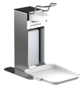
CWS MediLine Universalspender desiTop 500 mit Tropfschale