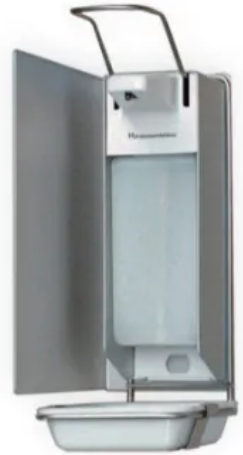
CWS MediLine Universalspender 500 + 1000 mit Montagewinkel und Tropfschale

Der Universalspender ist aus eloxiertem Aluminium und ausgestattet mit einer Edelstahlpumpe und flexiblem Kunststoff-Ansaugrohr. Die Pumpe kann entnommen und autoklaviert werden. Eine passende Tropfschale ist optional erhältlich.