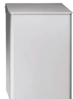
CWS MediLine Abfallbehälter 6 Liter

Als Werkstoff-/Oberflächenvarianten stehen Aluminium eloxiert, Aluminium weiß pulverbeschichtet und Edelstahl zur Auswahl.