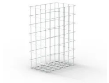
CWS MediLine Papierkorb 25 Liter

CWS bietet den MediLine Papierkorb in Edelstahl- oder Stahldraht-Version an. Die Version aus Stahldraht ist weiß pulverbeschichtet. Dabei verbindet sich eine dauerhafte Kunststoffversiegelung fest mit dem Metallgeflecht.