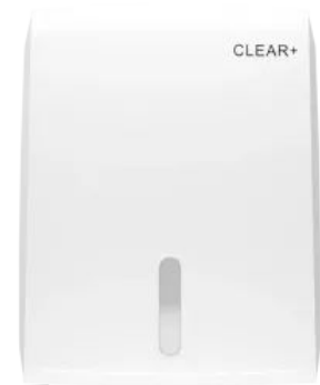
Clear+ Falthandtuchspender weiß

Nachhaltig durch Verzicht auf Batterien, Einsatz von nachhaltiger & veganer Clear+ Seife - dermatologisch getestet und biologisch abbaubar, frei von Mikroplastik.