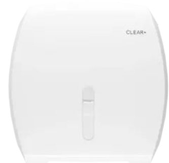
Clear+ Jumbo Toilettenpapierspender weiß

Nachhaltig durch Einsatz von CWS Recyclingpapier mit EU-Ecolabel.