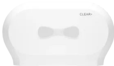
Clear+ Midi Toilettenpapierspender weiß

Aus der Serie CWS CLEAR+ Hygienelösungen von CWS Hygiene Deutschland