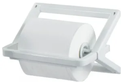
Clear+ Industrie Rollenpapierspender für Montage, weiß

Aus der Serie CWS CLEAR+ Hygienelösungen von CWS Hygiene Deutschland