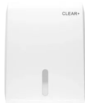
Clear+ Falthandtuchspender weiß

Nachhaltig durch Verzicht auf Batterien, Einsatz von nachhaltiger & veganer Clear+ Seife - dermatologisch getestet und biologisch abbaubar, frei von Mikroplastik.