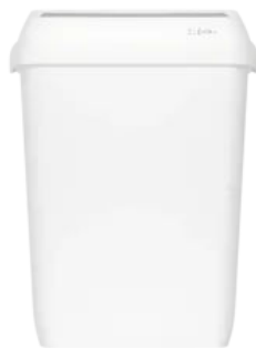
Clear+ Abfallbehälter / Papierkorb 43 l

Aus der Serie CWS CLEAR+ Hygienelösungen von CWS Hygiene Deutschland