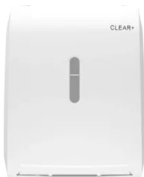
Clear+ Handtuchrollen-Spender weiß

Aus der Serie CWS CLEAR+ Hygienelösungen von CWS Hygiene Deutschland