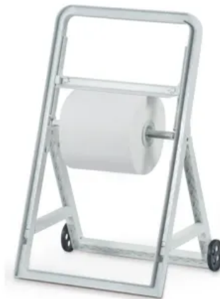
Clear+ Industrie Rollenpapierspender stehend, weiß

Nachhaltig durch Vermeidung von Papierverschnitt, langlebige Konstruktion und Einsatz von CWS-Recyclingpapier mit EU-Ecolabel.