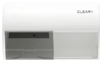
Clear+ Toilettenpapierspender weiß

Abfall- und Hygienebehälter, Duftspender