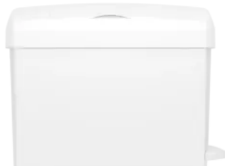
Clear+ Abfallbehälter für Hygieneabfälle

Nachhaltig durch Einsatz ohne Müllbeutel und Langlebigkeit.