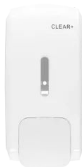
Clear+ Seifenspenderspender 1000 ml weiß

Nachhaltig durch Verzicht auf Batterien, sparsame Einzelblattausgabe und Einsatz von CWS-Recyclingpapier mit EU-Ecolabel.