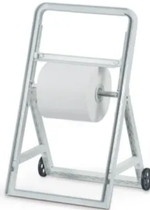
Clear+ Industrie Rollenpapierspender stehend, weiß