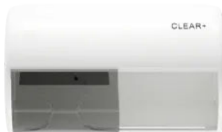
Clear+ Toilettenpapierspender weiß

Abfall- und Hygienebehälter, Duftspender