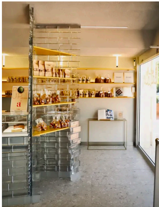
Glasziegel Crystal Collection

Varianten: Klar, Seidenmatt (allseitig), Seidenmatt (nur rückseitig)