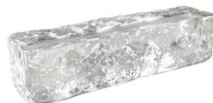
Crystal Collection, Ice