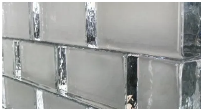
Glasziegel Crystal Collection

Aus der Serie Glasbausteine, Glasziegel und Zubehör von Fuchs Design