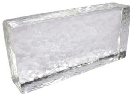
Crystal Collection, Hammerschlag