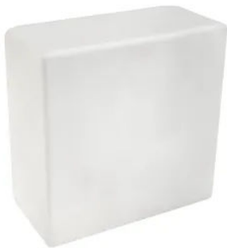
Crystal Collection, seidenmatt

Aus der Serie Glasbausteine, Glasziegel und Zubehör von Fuchs Design