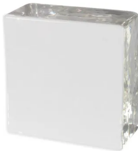
Klar und Seidenmatt