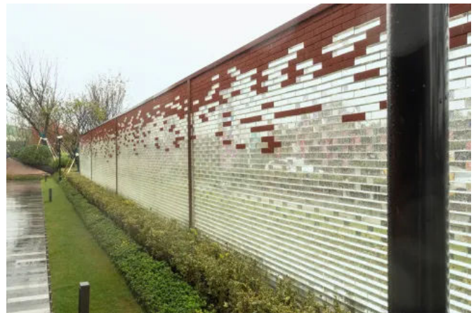
Glasziegel Crystal Collection