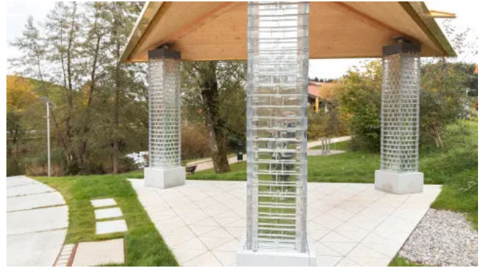
Glasziegel Crystal Collection