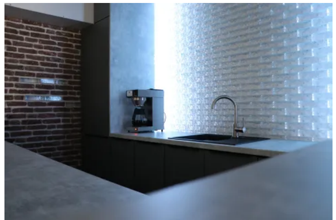
Glasziegel Crystal Collection