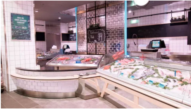
Glasziegel Crystal Collection

Aus der Serie Glasbausteine, Glasziegel und Zubehör von Fuchs Design