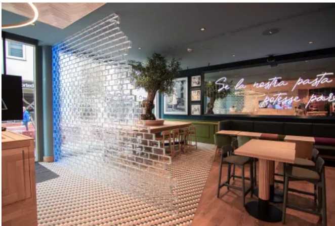
Glasziegel Crystal Collection