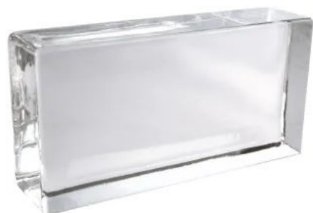
Crystal Collection Klar, Klassisch Glänzend