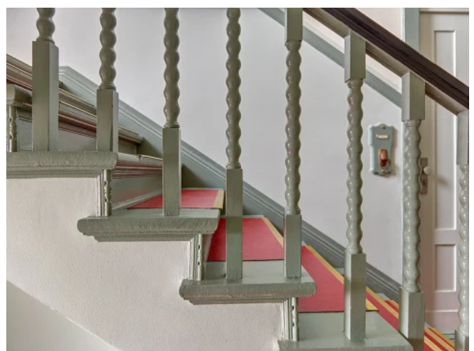
Wohngebäude, Berlin Spandau - Architekt: