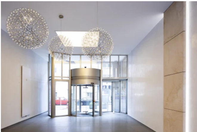
RÜ-Karree, Essen - Planung: Brockhoff und Partner Immobilien