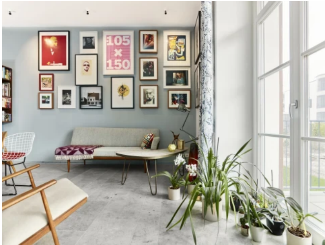
Privatwohnung, Ingolstadt - Planung: NO W HERE Architekten Designer

Aus der Serie Innenraumgestaltung von CAPAROL Farben Lacke Bautenschutz