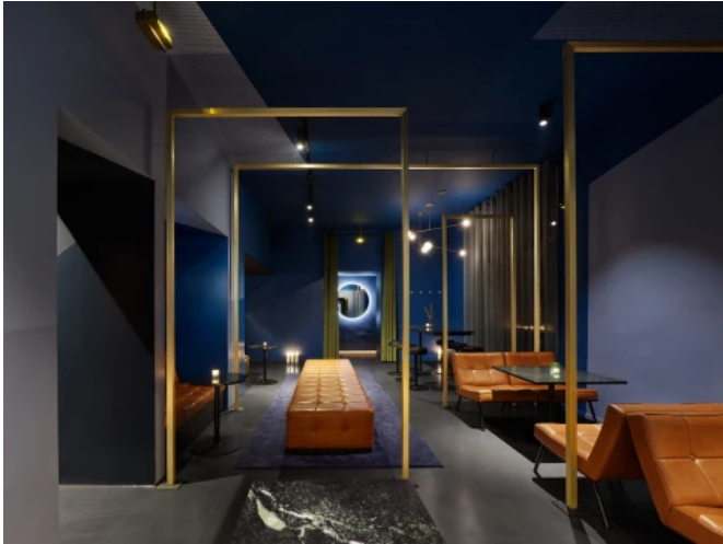
Barlounge Blau, Stuttgart - Planung: Somaa

Aus der Serie Innenraumgestaltung von CAPAROL Farben Lacke Bautenschutz