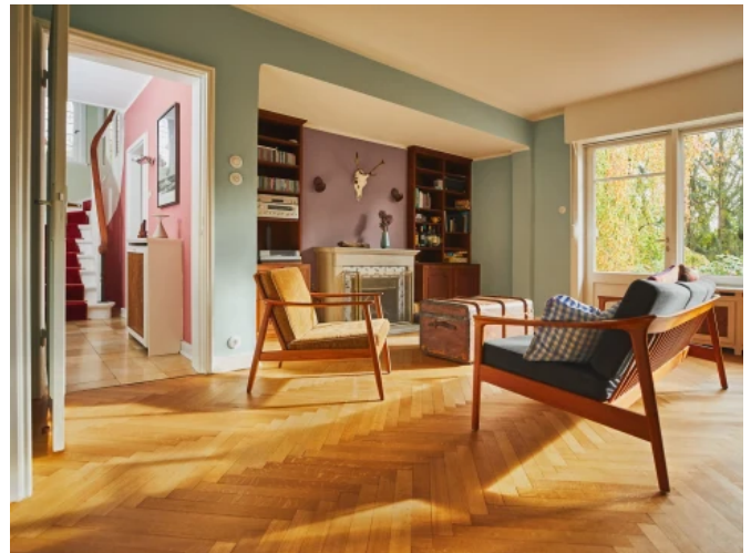
Einfamilienhaus, Hamburg - Planung: Caparol / Dipl.-Des. Martina Lehmann | Foto: Caparol