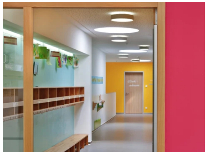
Kindergruppe St. Johannes, Pfaffenhofen a. d. Ilm - Planung: ArchiZell Projekt GmbH | Foto: Caparol