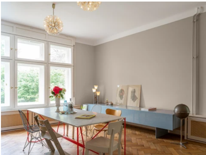
Gründerzeitvilla, Göttingen - Planung: Prof. Markus Schlegel, HAWK Hildesheim / Caparol