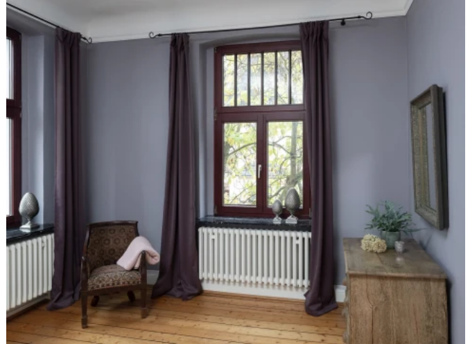
Jugendstilvilla, Essen - Planung: Caparol / Dipl.-Des. Margit Vollmert