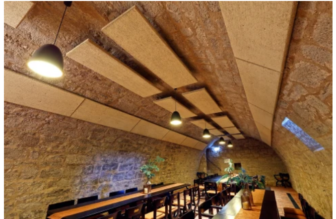
Burg Scharfenstein, Leinefelde Worbis - Planung: Number Nine Spirituosen Manufaktur GmbH | Foto: Caparol / Udo Stieglitz Fotografie Sangerhausen