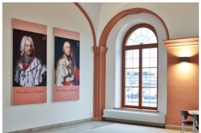
LBB, Niederlassung Koblenz - Planung: LBB | Foto: Caparol / Martin Duckek