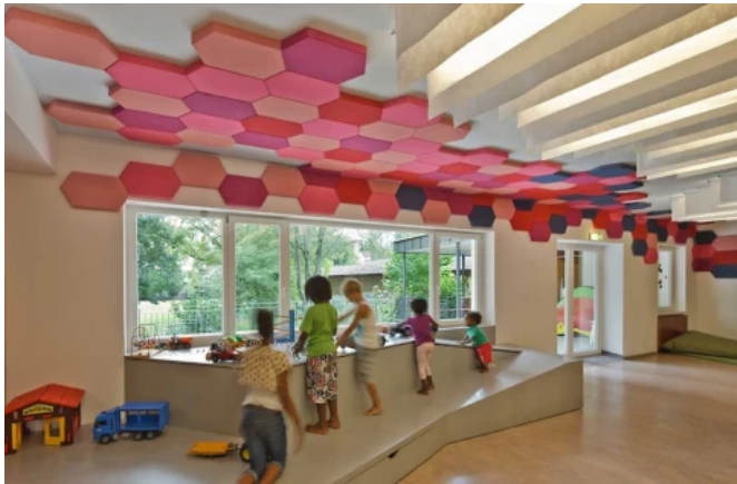
Murgels Spielhaus, Beiersbronn - Planung: partnerundpartner-architekten

Aus der Serie Innenraumgestaltung von CAPAROL Farben Lacke Bautenschutz