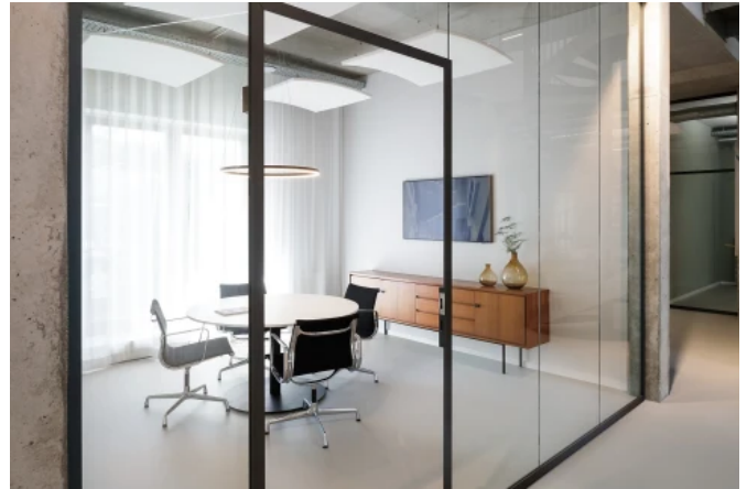
Büroräume Agentur SCRIPT Communications, Frankfurt/Main - Planung: SCRIPT / Caparol