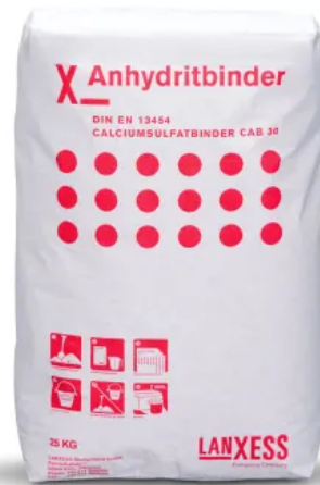
Lanxess Anhydritbinder

Estriche auf Basis von LANXESS Anhydritbinder geben weitaus weniger flüchtige organische Verbindungen (VOC) ab, als nach den strengen Vorgaben des »Ausschusses zur Gesundheitlichen Bewertung von Bauprodukten« (AgBB) gefordert wird, und sind somit uneingeschränkt als Bauprodukte für die Verwendung in Innenräumen geeignet. Weiterhin wurden die LANXESS Anhydritbinder nach der belgischen und der französischen Emmissionsverordnung geprüft und erfüllen alle Anforderungen.