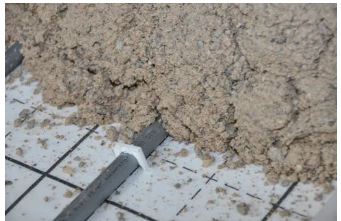
Konventioneller Calciumsulfatestrich auf Fußbodenheizung

Calciumsulfatestriche können vom Zeitpunkt der Begehrbarkeit an schadensfrei technisch getrocknet werden. Hierbei kommen Bautrocknungsgeräte in Form von Kondensationstrocknern zum Einsatz. Bauverzögerungen durch Vorgewerke lassen sich wieder aufholen.