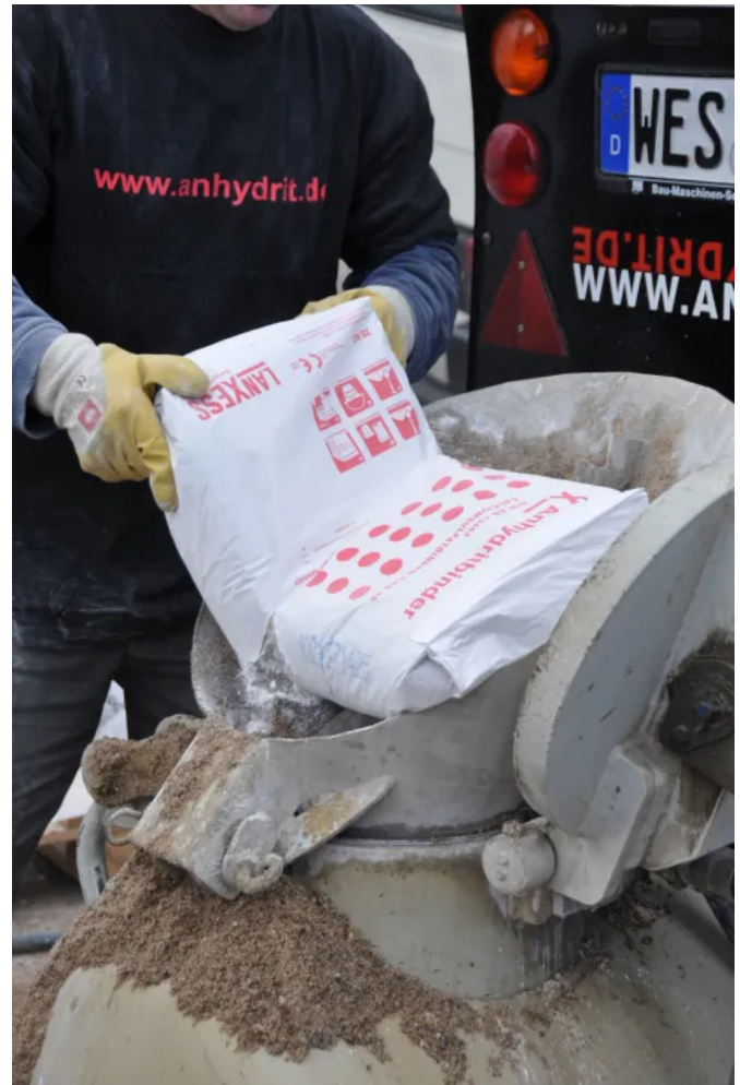
Lanxess Anhydritbinder zur Herstellung von konventionellem Calciumsulfatestrich auf der Baustelle

LANXESS Anhydritbinder ist geeignet zur Herstellung von Verbundestrichen, Estrichen auf Trenn- und Dämmschichten sowie Heizestrichen nach DIN 18560. Das Bindemittel aus dem Hause LANXESS ist als Sackware für die Verlegung von Baustellenestrichen und als Siloware für Calciumsulfatestriche und Calciumsulfat-Fließestriche aus Fahrmischer-, Mixmobilen und Silosystemen lieferbar.