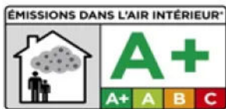
Französische Auszeichnung „Emissions dans l'air intérieur A+“