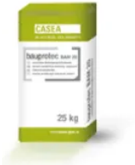
bauprotec BAM 20