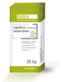
casufloor AB 30 syn