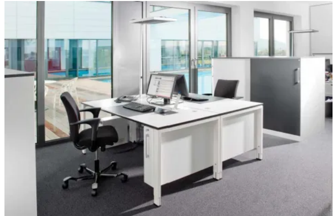
Doppelarbeitsplatz mit Asisto Tischen und den für die Firma SCHNEIDER entwickelten Orgatowern.