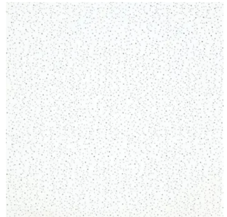
Finetta: genadelt/geprägt, farbbeschichtet weiß