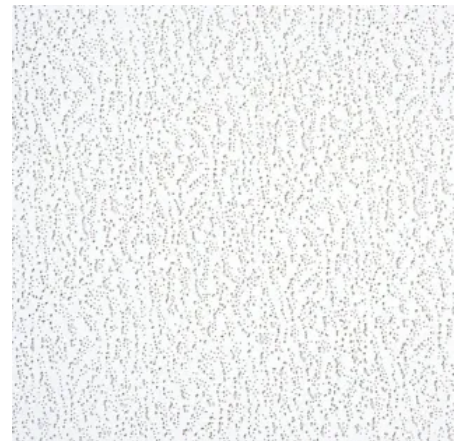
Harmony: genadelt/geprägt, farbbeschichtet weiß