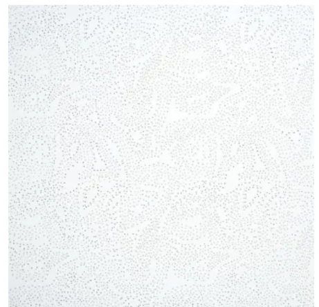
Sternbild: genadelt/geprägt, farbbeschichtet weiß