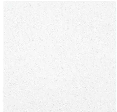
NEW Sandila: gesandet, farbbeschichtet weiß