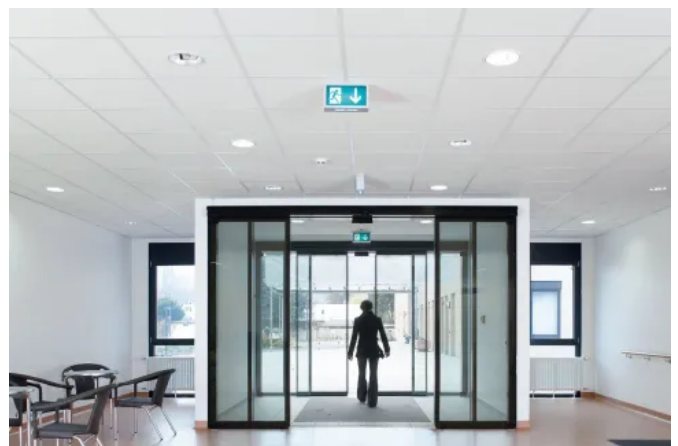
OWA Unterdeckensysteme sind mit verschiedenen lasttragenden Konstruktionen hinsichtlich ihres Feuerwiderstandes nach DIN EN 13501-2 geprüft.

Bei OWA sind auch die Unterkonstruktionssysteme geprüft, sodass die Leistungserklärung (DoP) für den gesamten Bausatz - inklusive Feuerwiderstand - vorliegt.