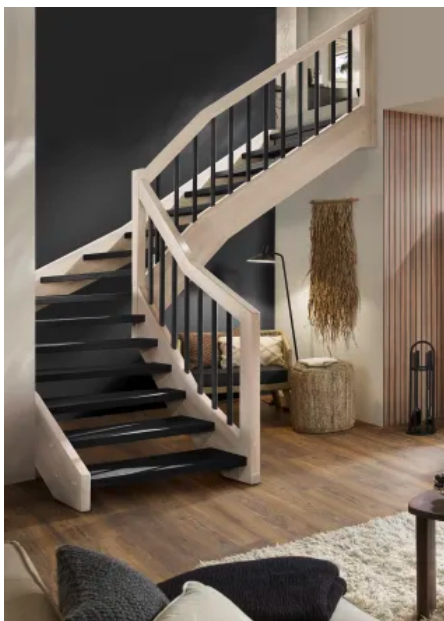
Holztreppe 676 F30-B