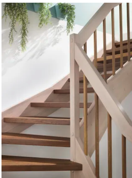
Holztreppe 698g F30-B (© Treppenmeister GmbH)