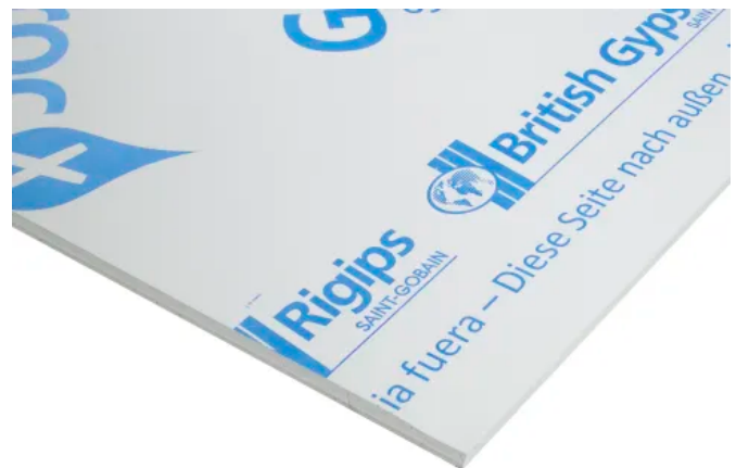
Gipsplatte Glasroc X