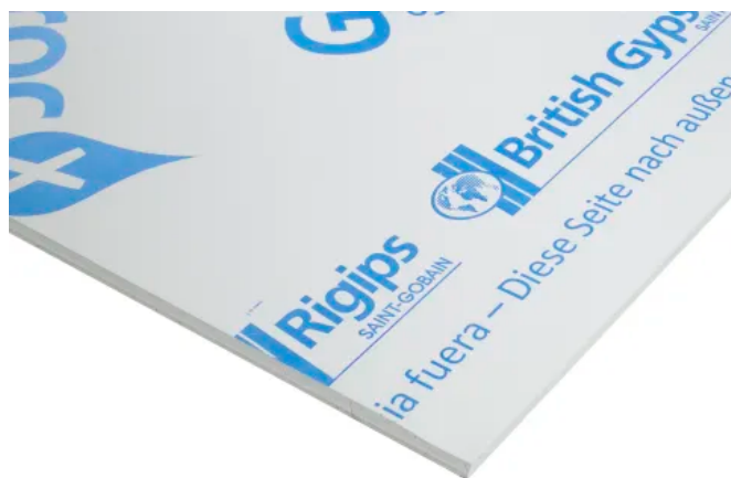
Gipsplatte Glasroc X