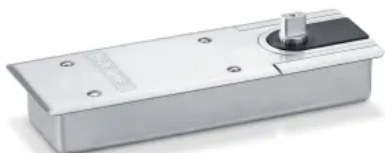
TS 550 NV – Bodentürschließer für einflügelige Anschlag- und Pendeltüren bis 1400 mm Flügelbreite mit einstellbarer Schließkraft EN 3-6 und mit ein- und ausschaltbarer Feststellung