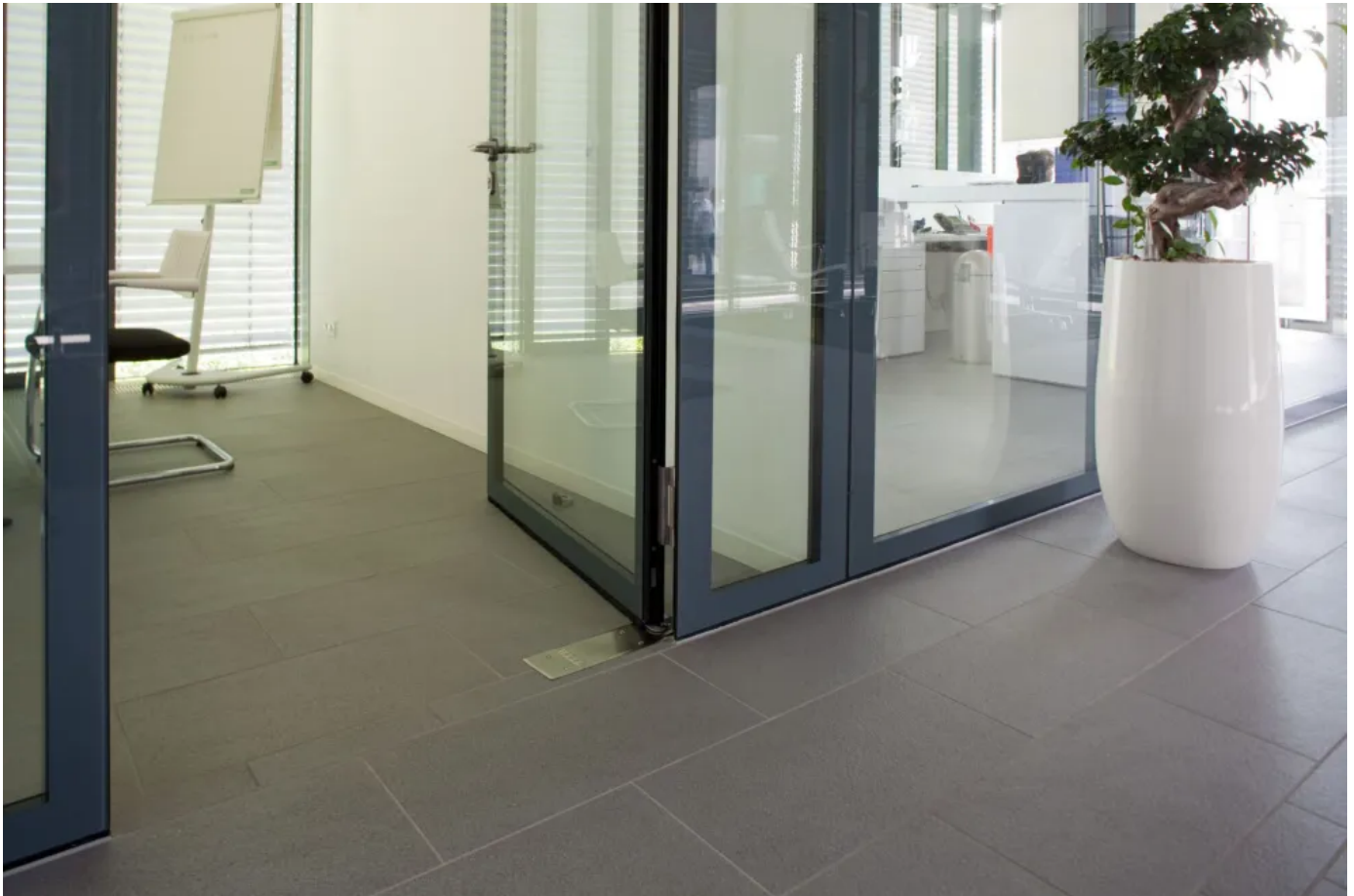
TS 550 NV – Bodentürschließer für einflügelige Anschlag- und Pendeltüren