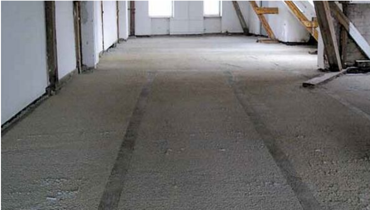
Leichtausgleichsmasse auf Basis Zement-Styropor

Aus der Serie Bodensysteme von Saint-Gobain Weber