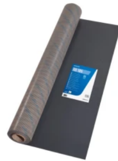
UZIN RR 185: Flexible, lose auszuliegende, stabilisierende und dampfdichte Unterlage