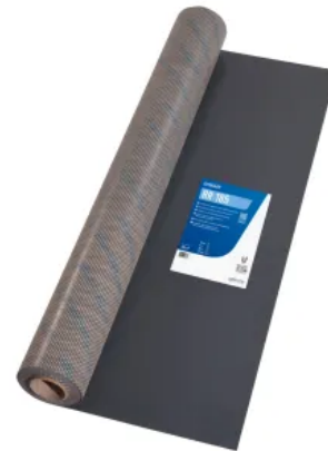
UZIN RR 185: Flexible, lose auszulegende, stabilisierende und dampfdichte Unterlage