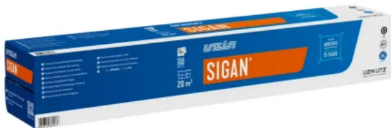
UZIN SIGAN®: Trockenklebstoff für PVC-/CV-Beläge, chlorfreie oder PUR-Beläge, Designbeläge, Kautschukbeläge, Textilbeläge