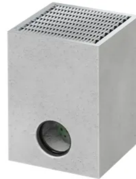
BIRCOplus Punktentwässerung 30/30