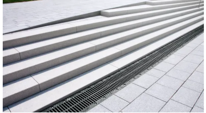
BIRCOsir® NW 200 Treppentwässerung