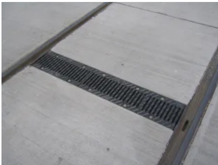
BIRCOsir® - Gleisentwässerung