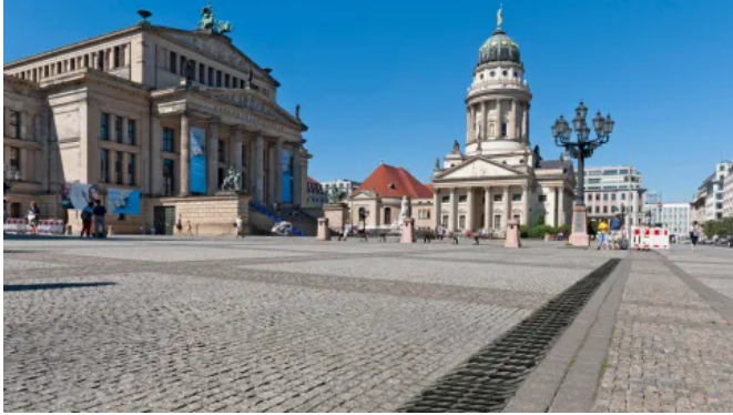
BIRCOsir® NW 200

Aus der Serie Entwässerungsrinnen von BIRCO