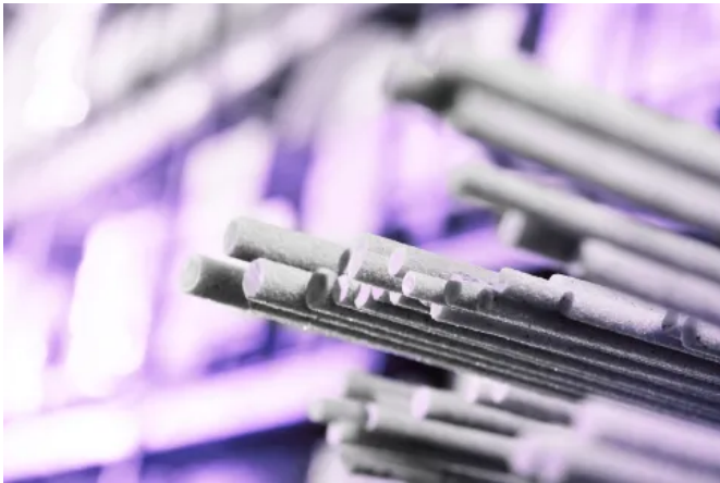
FIBERNOX® V-ROD GFK-Bewehrung