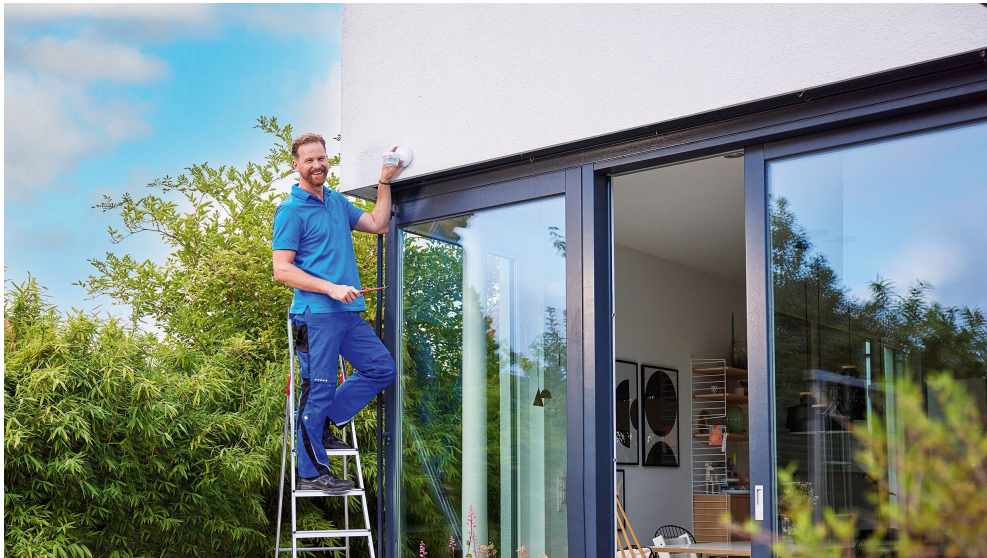
ABB AG Busch-Jaeger Freisenbergstr. 2 58513 Lüdenscheid Deutschland