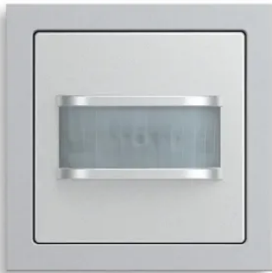
Busch-Wächter® 180 flex

Aus der Serie Bewegungs- und Präsenzmelder von ABB Busch-Jaeger