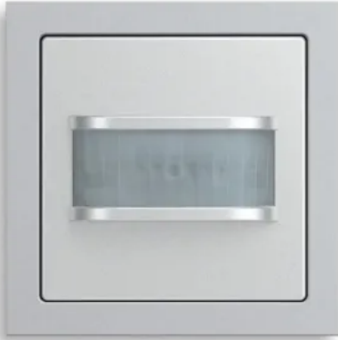
Busch-Wächter® 180 flex

Aus der Serie Bewegungsmelder und Präsenzmelder von ABB Busch-Jaeger