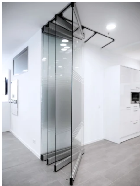
MSW Comfort – Bewegliches Ganzglas-Trennwandsystem, © GEZE GmbH / Jürgen Biniasch

Aus der Serie Glastrennwandsysteme von GEZE