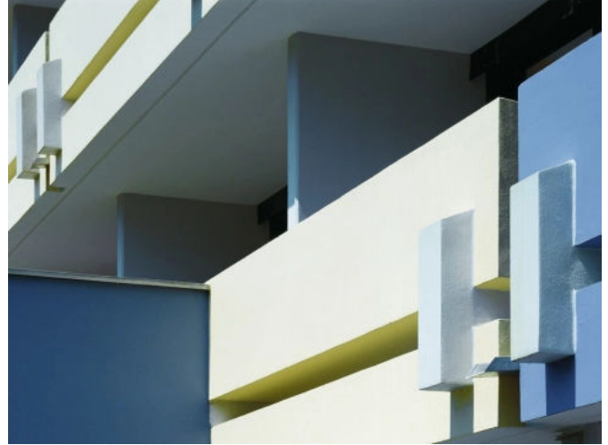
StoCrete TF 200, StoCrete FS, StoCrete SM P, StoCryl RB, StoPur EB 200, StoChipsAlten- und Wohnpflegeheim, Forchheim, DE.