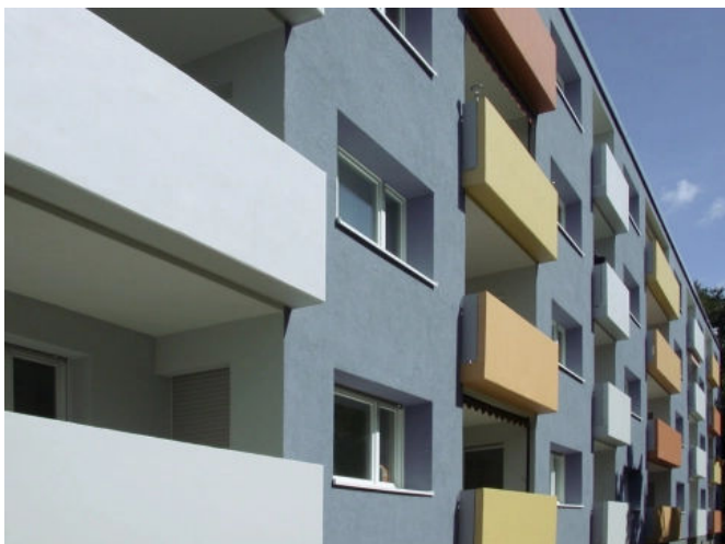
Balkonsanierung und Bodenbeschichtung von Wohnanlagen.