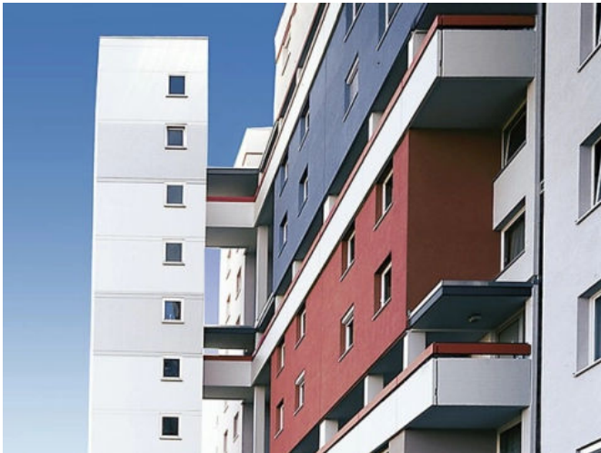
StoCrete ES, StoCrete TS 200, StoCrete SM, StoCrete TF 200, StoCrete TG 202, StoCrete TH 200, StoCryl RB, StoCryl V 200, Wohnanlage, Waiblingen, DE.