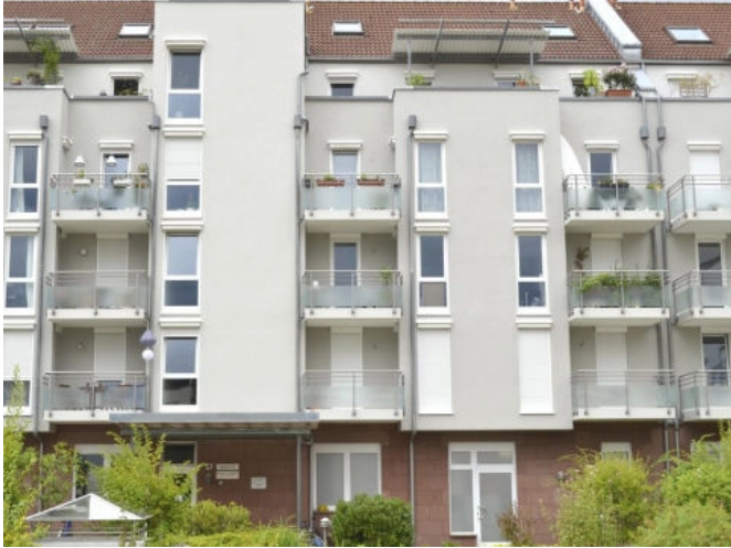
Instandsetzung von begehbaren Bodenflächen aus Stahlbeton, WEG Antoniterstraße, Freiburg, DE.

Aus der Serie Betoninstandsetzung, Betonschutz und Bodenbeschichtungen von StoCretec