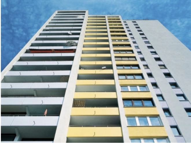
Balkone schützen und gestalten.

Aus der Serie Betoninstandsetzung, Betonschutz und Bodenbeschichtungen von StoCretec