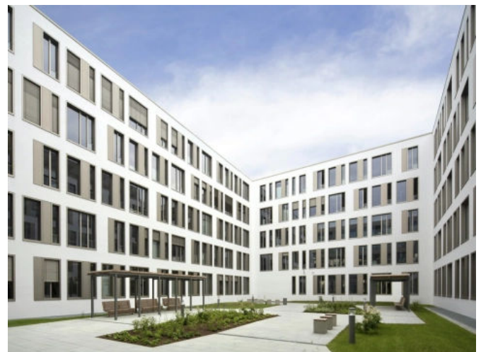
Aufeinander abgestimmte Systemlösungen im Wohnungs- und Verwaltungsbau.