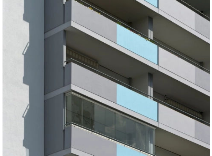
Beschichtungssysteme für den Balkon. Wohnanlage, Berlin, DE Bauherr: HOWOGE Wohnungsbaugesellschaft mbH, Berlin, DE.