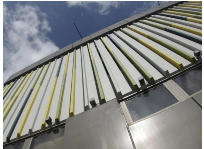
Betoninstandsetzung mit dem Schnellreparaturmörtel StoCrete SM, Karstadt Filiale, Singen (Hohentwiel), DE.