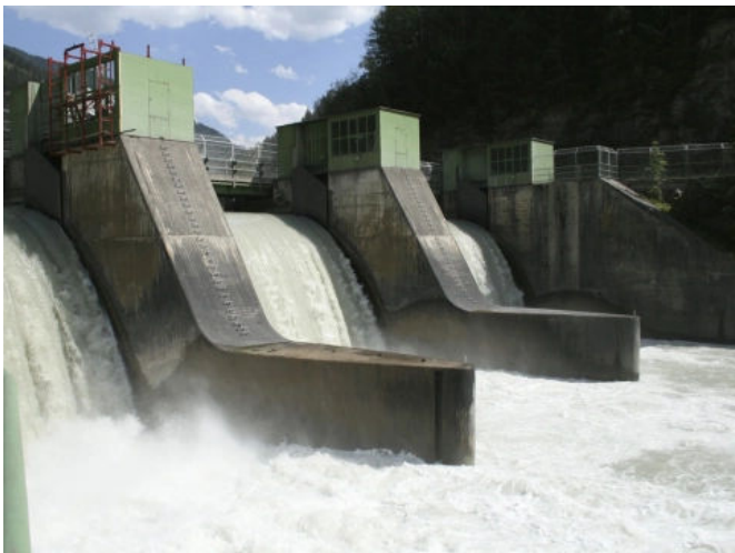
Funktionalität von Wasserbauwerken gewährleisten.