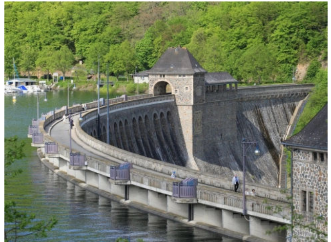
Zerstörung des Betons durch klimatisch exponierte Standorte, mechanische Verformungen und abrasive Belastungen.