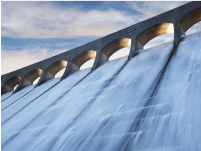
Lösungskonzepte sowie spezielle für den Wasserbau geprüfte und zugelassene Produktsysteme.

Aus der Serie Betoninstandsetzung, Betonschutz und Bodenbeschichtungen von StoCretec