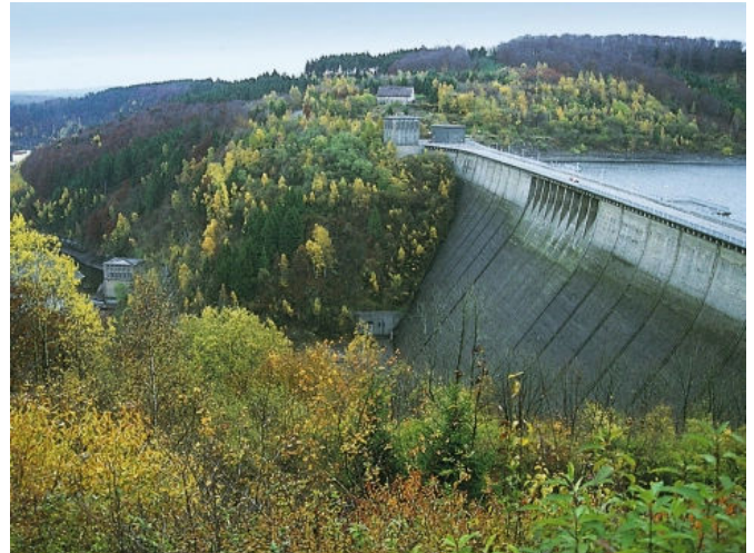
Dauerhafter Betonersatz, StoConcrete Repair Prime TS 100, Trinkwasserkraftwerk, Rappode/Rübeland, DE.