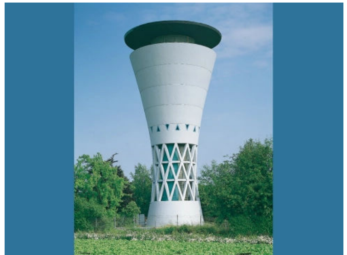
Tragwerksverstärkung und Oberflächenschutz. Wasserturm Ludwigsburg, DE.