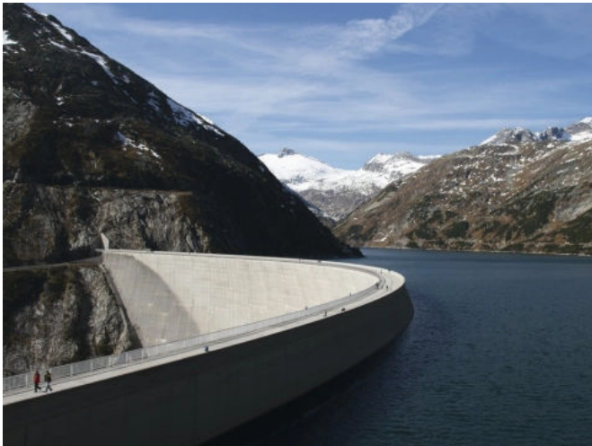
Wasserbauten aus Stahlbeton: Instandsetzen, verstärken und schützen.