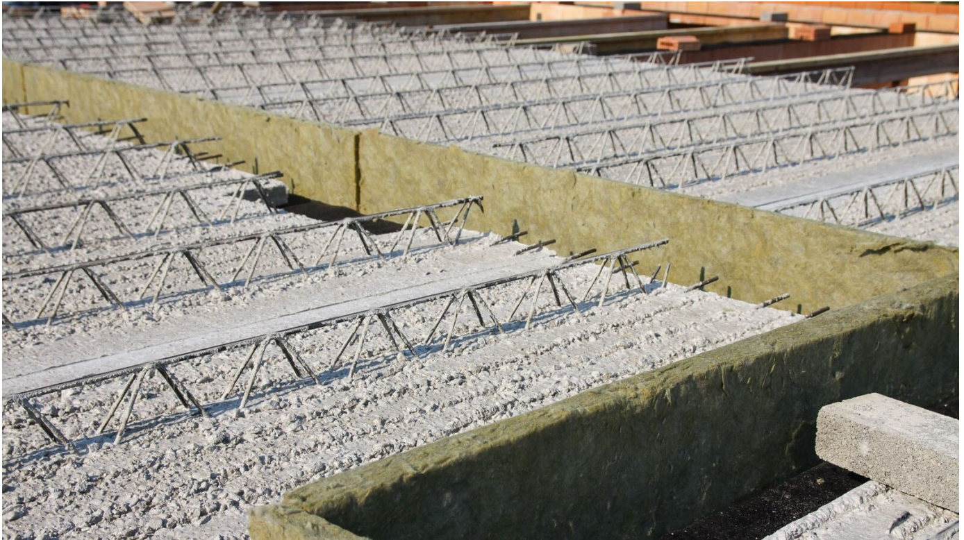
Betonfertigteile – Deckenplatten mit Ortbetonergänzung für Geschoss- und Dachdecken

Aus der Serie Fertigteildecken für Geschoss- und Dachdecken von August Lücking