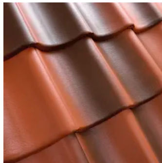
Flash (Ziegelrot/ Braun), Benderit