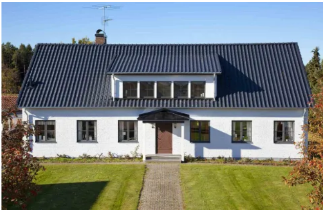
Einfach-S, Brilliant, Schiefer