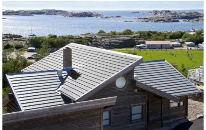
Carisma, Granit, oberflächenbehandelt