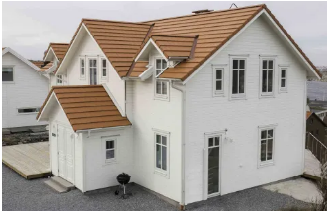
Carisma, Ziegelrot, oberflächenbehandelt

Aus der Serie Benders Dach von Benders Deutschland