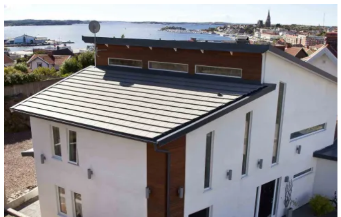
Carisma, Mittelgrau, oberflächenbehandelt