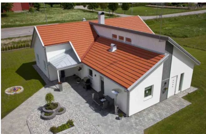
Carisma, Ziegelrot, oberflächenbehandelt