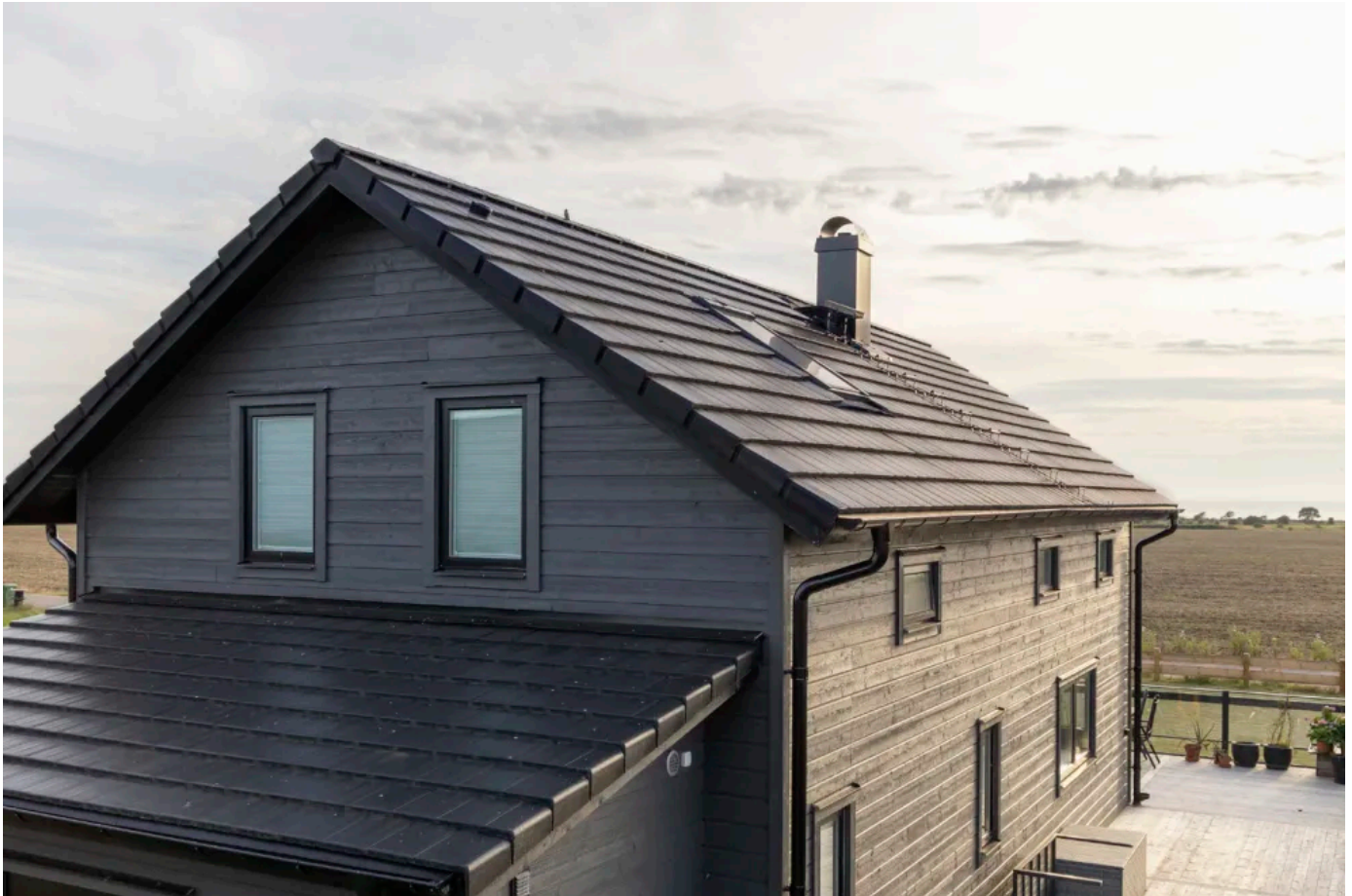
Carisma, Schwarz, Candor