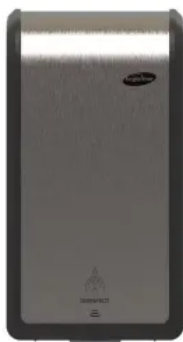
Händedesinfektionsspender XIBU METAL DISINFECT hybrid