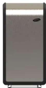
Toilettenpapierspender XIBU METAL TISSUEPAPER hybrid