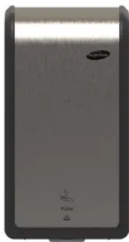
Schaumseifenspender XIBU METAL FOAM hybrid

Aus der Serie Hygienespender für Desinfektion, Wasch- und Sanitärbereiche von Hagleitner Hygiene International