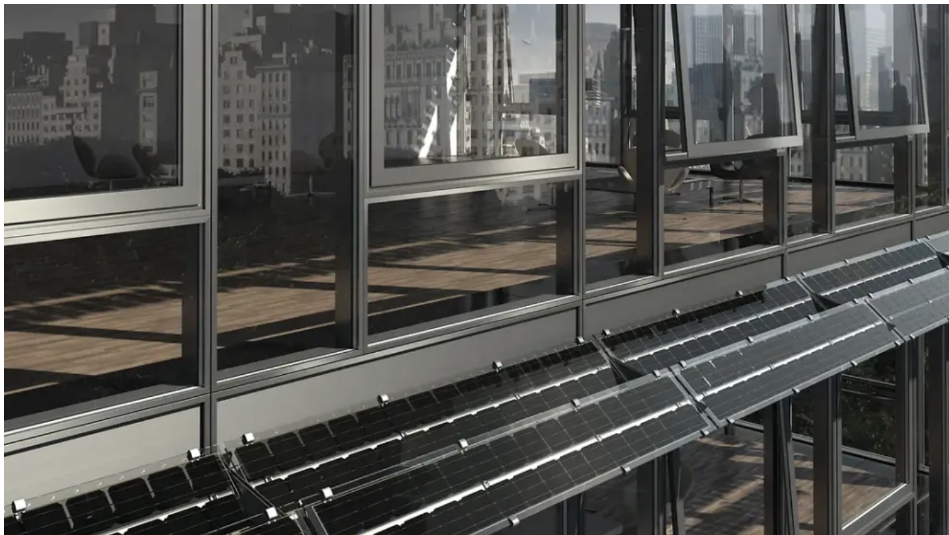
BIPV als Vordach

Ob Fenster, Eingangsbereiche oder Terrassen: Lamellen, Schiebeläden oder Vordächer bieten in Verbindung mit den Photovoltaikmodulen kreative Lösungen, um individuelle Architektur zu gestalten - und gleichzeitig Schutz vor Sonneneinstrahlung und Niederschlag zu bieten.