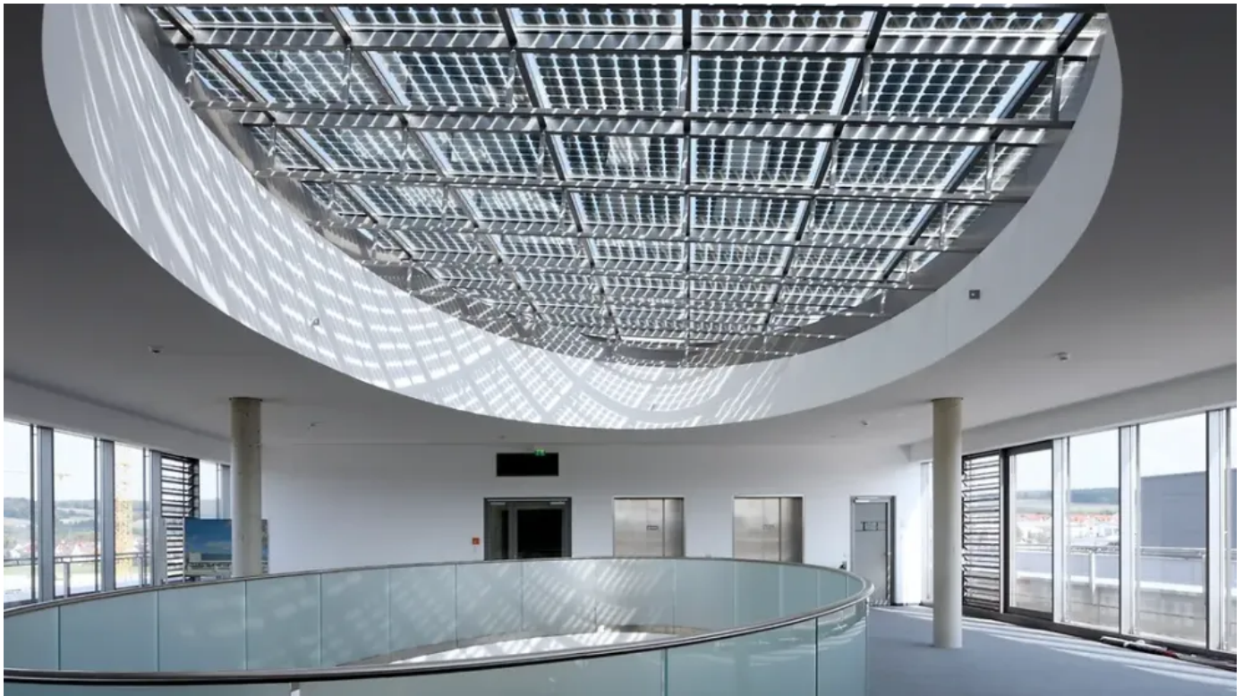
BIPV-Module für Lichtdächer

Die semitransparenten Überdachungen können sowohl den Wärme-, Sonnen-, Blend- und Witterungsschutz des Gebäudes übernehmen also auch gezielte Tageslichtnutzung ermöglichen. Als multifunktional Einselemente in Lichtdachkonstruktionen ermöglichen Schüco BIPV-Model solare Architekturlösungen mit variantenreicher Innen- und Außengestaltung.