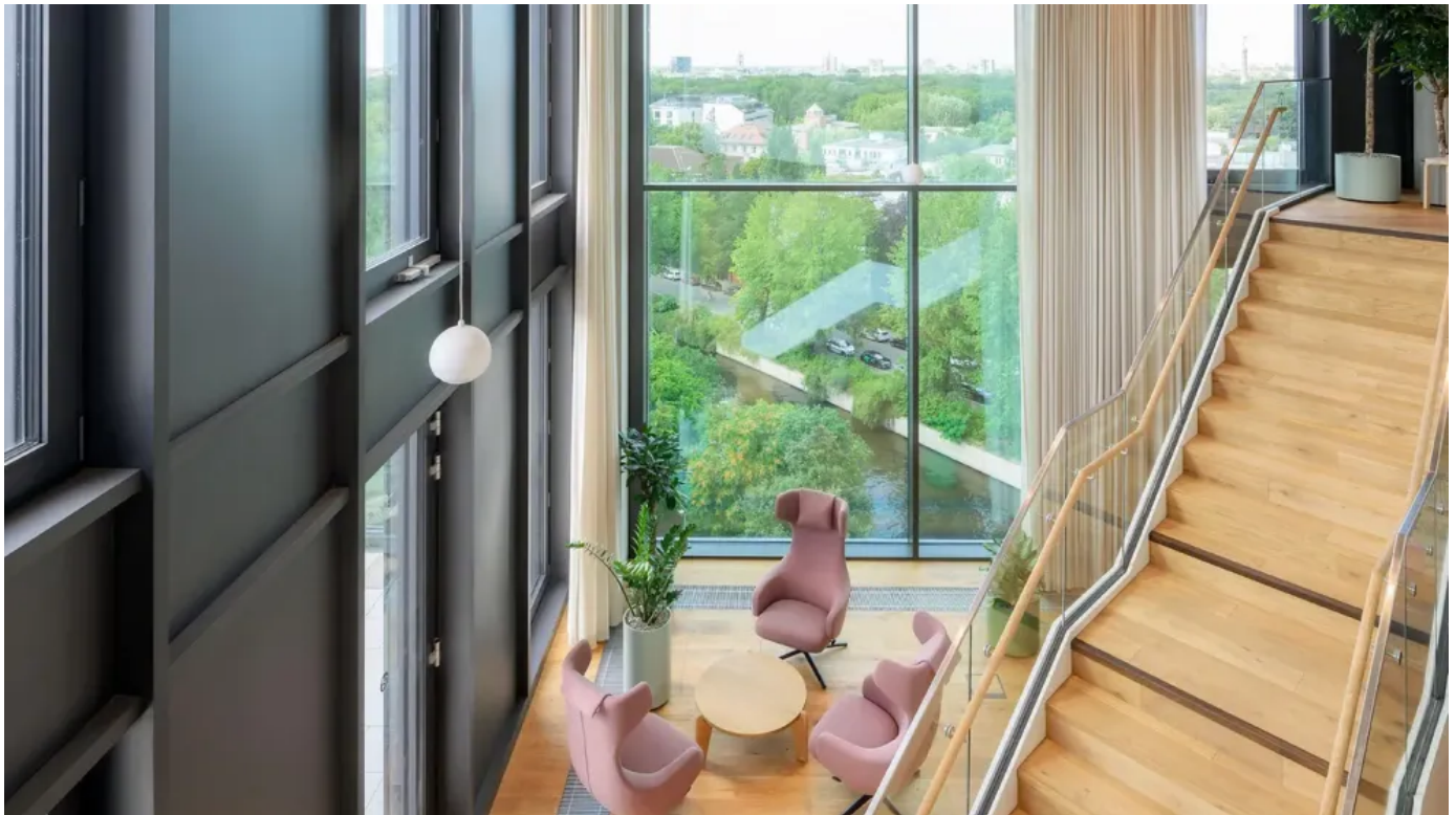
Warmfassade bei Berlin Hyp

Eine solare Warmfassade mit Schüco BIPV Modulen als Füllungselemente realisiert alle an eine Fassade gestellten Anforderungen des Raumabschlusses: Statik, Wärmedämmung sowie Wetter- und Schallschutz. Die semitransparenten Isolierglasmodule zeichnen sich durch gut U-Werte und g-Werte aus und können konventionelle Isolierverglasungen mit zwei oder drei Scheiben gleichwertig ersetzen.