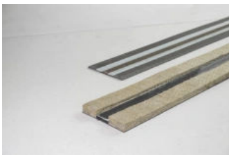
Egcodist Wand- und Deckenlager

Egcodist Wand- und Deckenlager vermeiden bereits in der Rohbauphase mögliche Bauschäden. Durch gezielte Lastzentrierung werden Abplatzungen infolge einer Rotation des Deckenaufagers vermieden. Nach DIN 18530 ist eine Zwischenlage zur Aufnahme dieser Verformungen anzuordnen. Das Egcodist Baulagerprogramm von MAX FRANK erfüllt diese Anforderungen. Dies bedeutet für den Anwender Planungssicherheit und für den Bauherrn eine dauerhaft intakte Stoßfuge Wand-Decke.