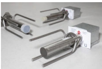
Egcopal Trittschalldämmter Querkraftdorn

Die Anforderungen an den Schallschutz in Gebäuden steigen seit Jahren. Um diesen Ansprüchen zu genügen, ist die Trittschalldämmung von Treppen und Podesten nachzuweisen. Der trittschalldämmte Querkraftanschluss Egcopal entkoppelt Bauteile zur Trittschallminderung. Er wird eingesetzt für die Auflagerung von Treppenpodesten, Laubengängen und vorgeständerten Balkonen und überträgt die in der Anschlussfuge wirkenden Querkräfte. Gleichzeitig sorgt die akustisch entkoppelte Auflagerung dafür, dass die Übertragung störender Geräusche in angrenzende Räume gedämmt wird – dies kann den Wohnkomfort und das Wohlbefinden der Bewohner steigern.