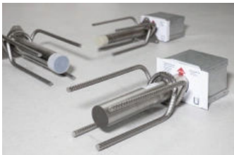
Egcopal Trittschalldämmter Querkraftdorn

Die Anforderungen an den Schallschutz in Gebäuden steigen seit Jahren. Um diesen Ansprüchen zu genügen, ist die Trittschalldämmung von Treppen und Podesten nachzuweisen. Der trittschalldämmte Querkraftanschluss Egcopal entkoppelt Bauteile zur Trittschallminderung. Er wird eingesetzt für die Auflagerung von Treppenpodesten, Laubengängen und vorgeständerten Balkonen und überträgt die in der Anschlussfuge wirkenden Querkräfte. Gleichzeitig sorgt die akustisch entkoppelte Auflagerung dafür, dass die Übertragung störender Geräusche in angrenzende Räume gedämmt wird – dies kann den Wohnkomfort und das Wohlbefinden der Bewohner steigern.