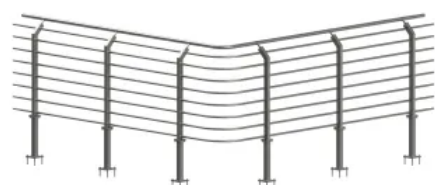
SKB Geländer VA - 10

SKB Geländer VA - 10, Klassisches Edelstahlgeländer zum Gebrauch im öffentlichen Bereich