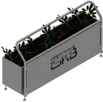
SKB Geländer VA - 5 Green

Aus der Serie Absturzsicherungen und Sicherheitskonzepte für Dächer von Sicherheitskonzepte Breuer