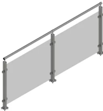
SKB Geländer VA - 5 Flex

SKB Geländer VA - 5 Flex, Edelstahlgeländer mit individuell anpassbarer Geländerfüllung