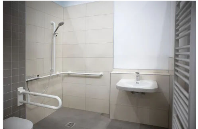
Vorgefertigte Badmodule für serielle Bauvorhaben

Dennert verfügt über ein QNG-Baureihenzertifikat für Badmodule. Dies unterstützt die Einbindung der Module in nachhaltig geplante Gebäude und erleichtert die Erfüllung entsprechender Förder- und Zertifizierungsanforderungen.