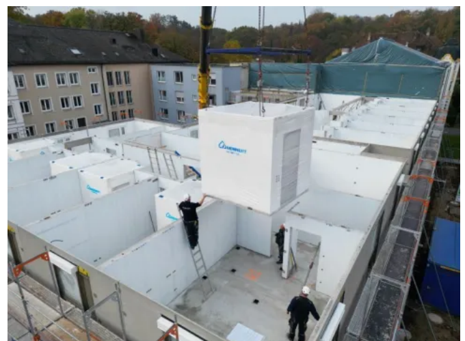
Vorgefertigte Badmodule für serielle Bauvorhaben

Die Badmodule werden unter kontrollierten Bedingungen industriell gefertigt und entsprechen den geltenden Normen und Qualitätsanforderungen. Die massive Bauweise gewährleistet einen hohen Schall- und Feuchteschutz und ist auf eine dauerhafte Nutzung im Geschosswohnungsbau ausgelegt. Die Produktion erfolgt nach DIN ISO 9001.