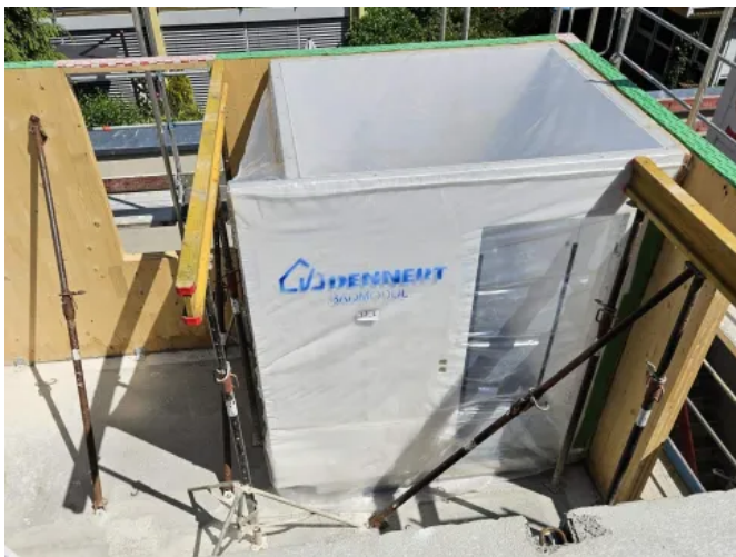
Vorgefertigte Badmodule für serielle Bauvorhaben