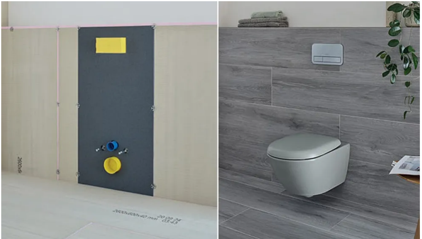
Einbausituation WC-Board vor und nach dem Fliesen der Wände