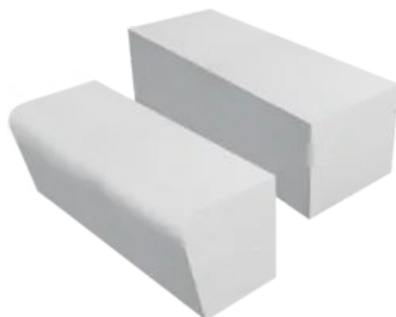
Austrotherm Wellness-Sitzbank mit abgerundeter und eckigiger Sitzkante