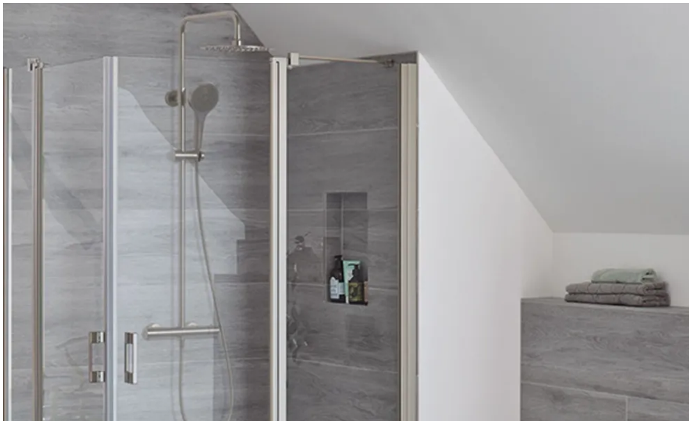
Austrotherm Fertigelement Wandnische im Duschbereich