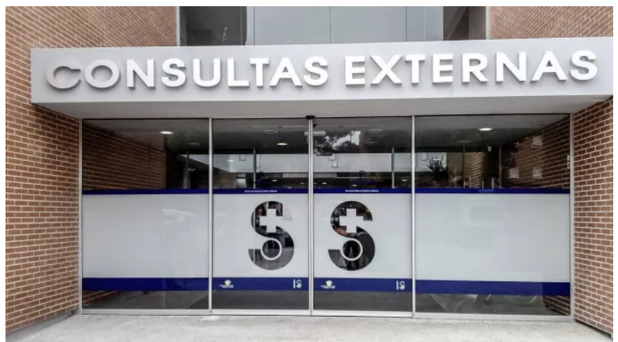
Hospital de Hellín, Spanien