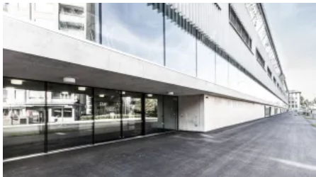
Berufsfachschule für Technik und Kunst in Freiburg, Schweiz

Aus der Serie Automatische Türsysteme / Automatiktüren von Gilgen Door Systems