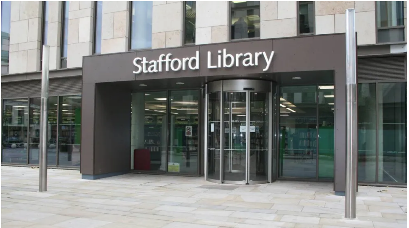
Stafford Library, UK

Gilgen bietet Rundschiebetüren in verschiedenen Radiusvarianten – nach außen oder innen gebogen bis hin zur kreisförmigen Windfanganlage –, optional mit Fluchtwegfunktion. Mit der runden Form lassen sich selbst bei engen Durchgangs-Situationen angenehme Raumverhältnisse realisieren.