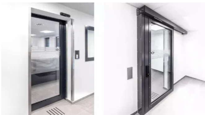
GILGEN SL-GUARD FB4 / RC3: Durchschusshemmend mit Einbruchschutz

Erhältlich in den Ausführungen "Fluchtweg", "Einbruchhemmung", "Modernisierung" und "Energieeffizienz"