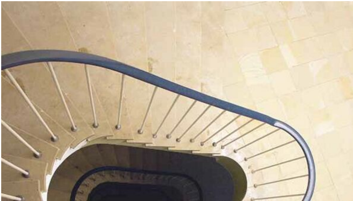
Boden-Nivellierausgleich, Alpha-Dünnestrich, Renovations- und Holzbodenausgleich

Aus der Serie Bodensysteme von Saint-Gobain Weber